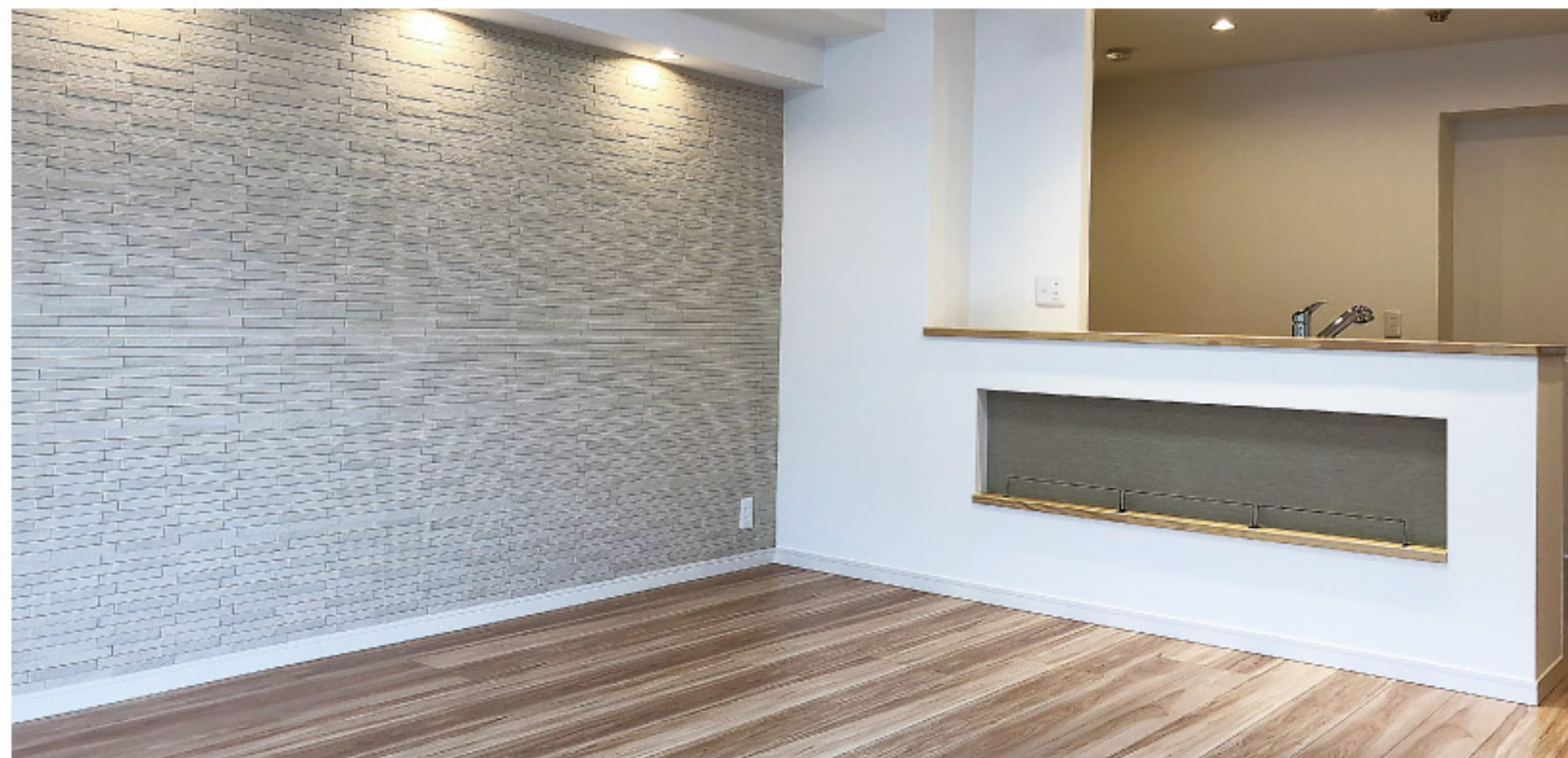
リビング・ダイニング・キッチン(約16.6畳)