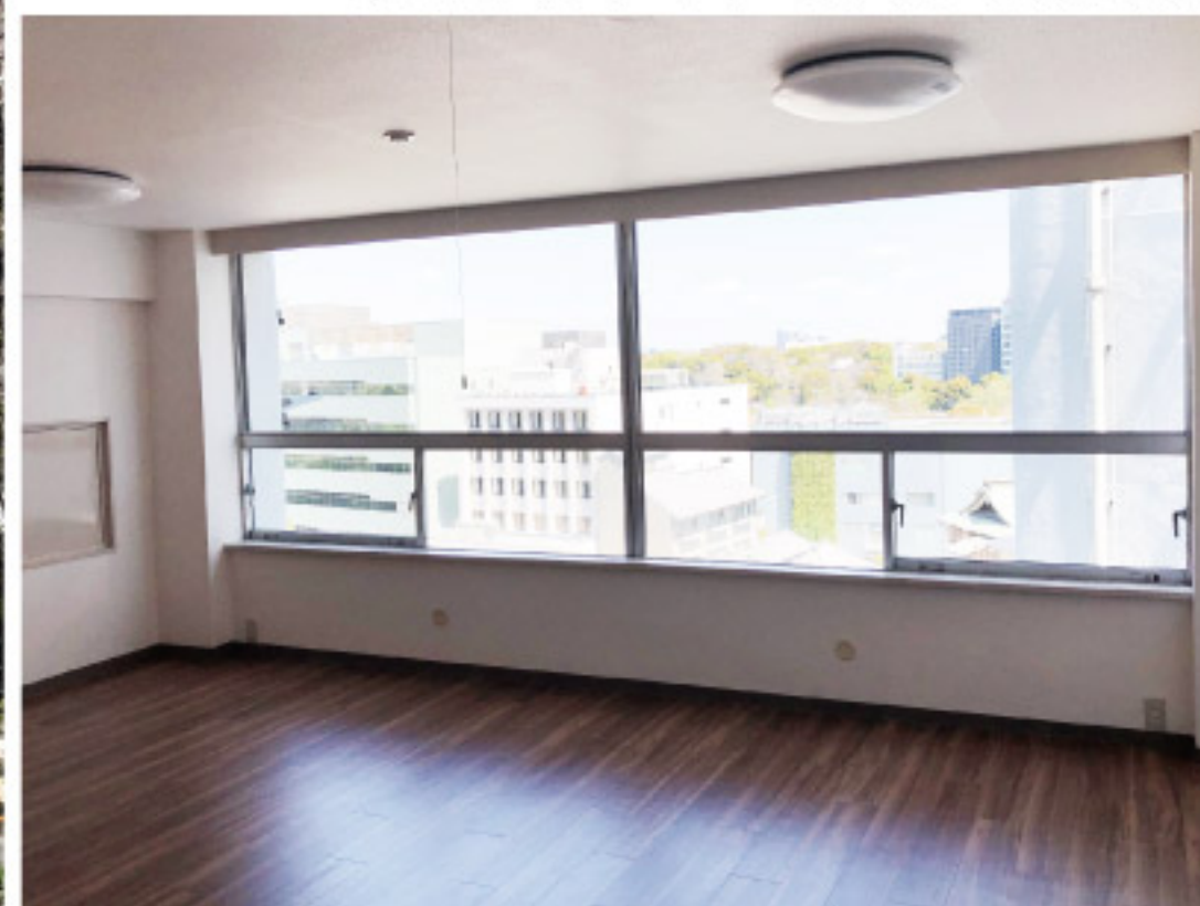
リビング・ダイニング・キッチン(約16.8畳)