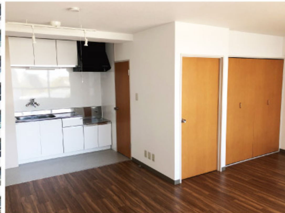
リビング・ダイニング・キッチン(約16.8畳)