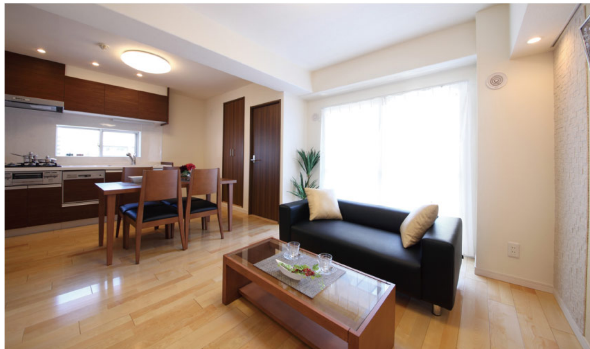
【イメージ写真】写真は一例ですので実際のものとは異なる場合があります。