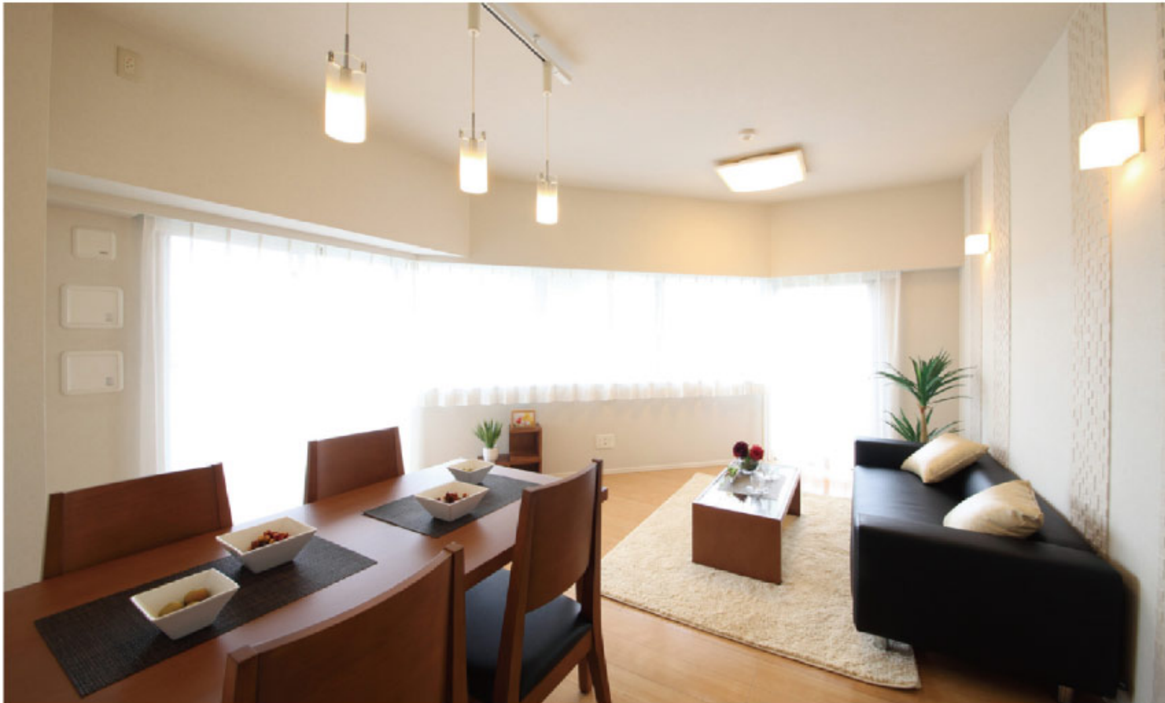
【イメージ写真】写真は一例ですので実際のものとは異なる場合があります。

当住宅は、リノベーション協議会の定める適合リノベーション 住宅のR1基準(マンション専有部内の給排水管などの重要 インフラに検査を行い、2年以上の保証および住宅履歴が 付帯)を満たした<R1住宅>です。