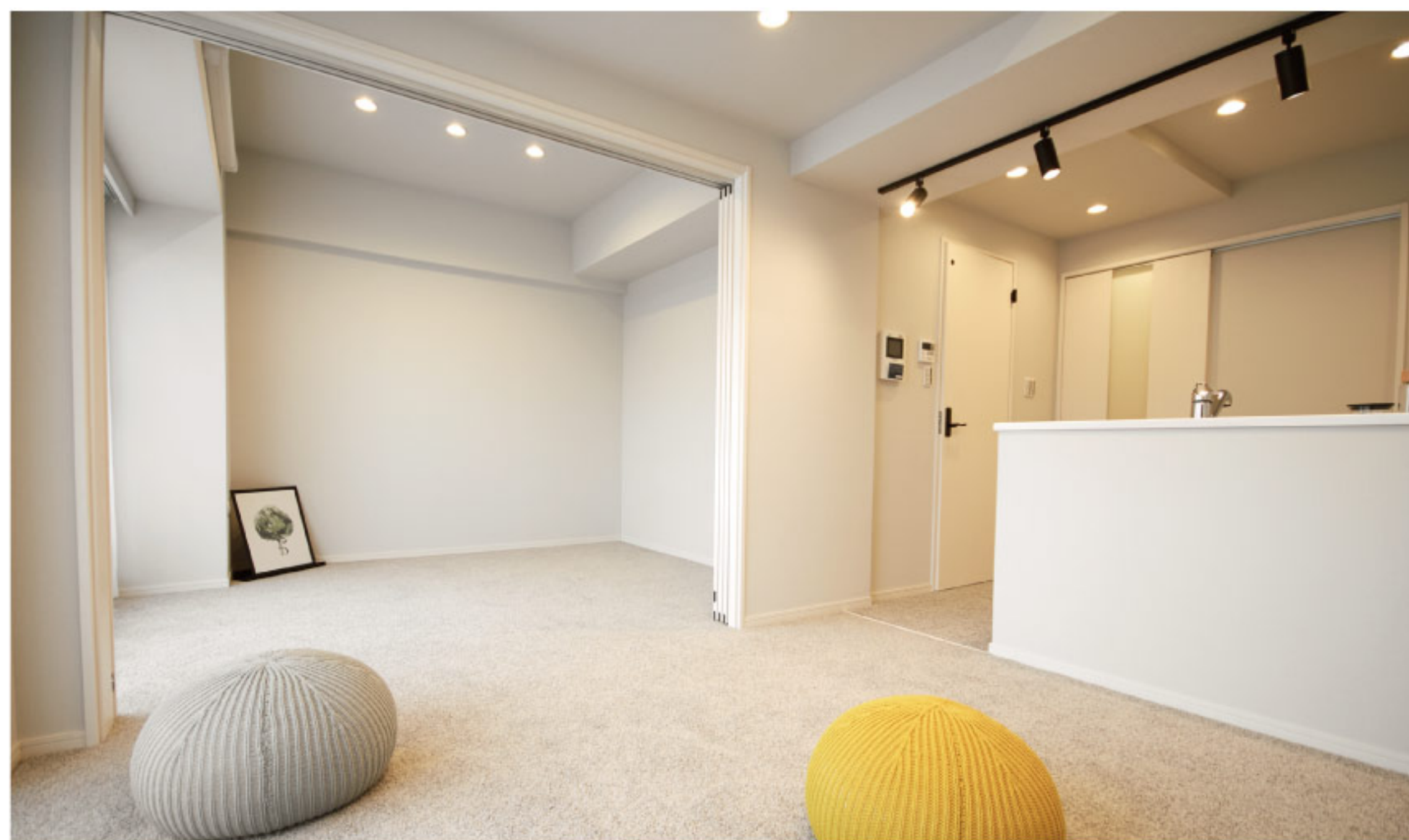
【イメージ写真】写真は一例ですので実際のものとは異なる場合があります。

陽当たりの良い南向きバルコニー眺望も良好♪ ～練馬駅徒歩10分圏内 3駅2路線利用できます～