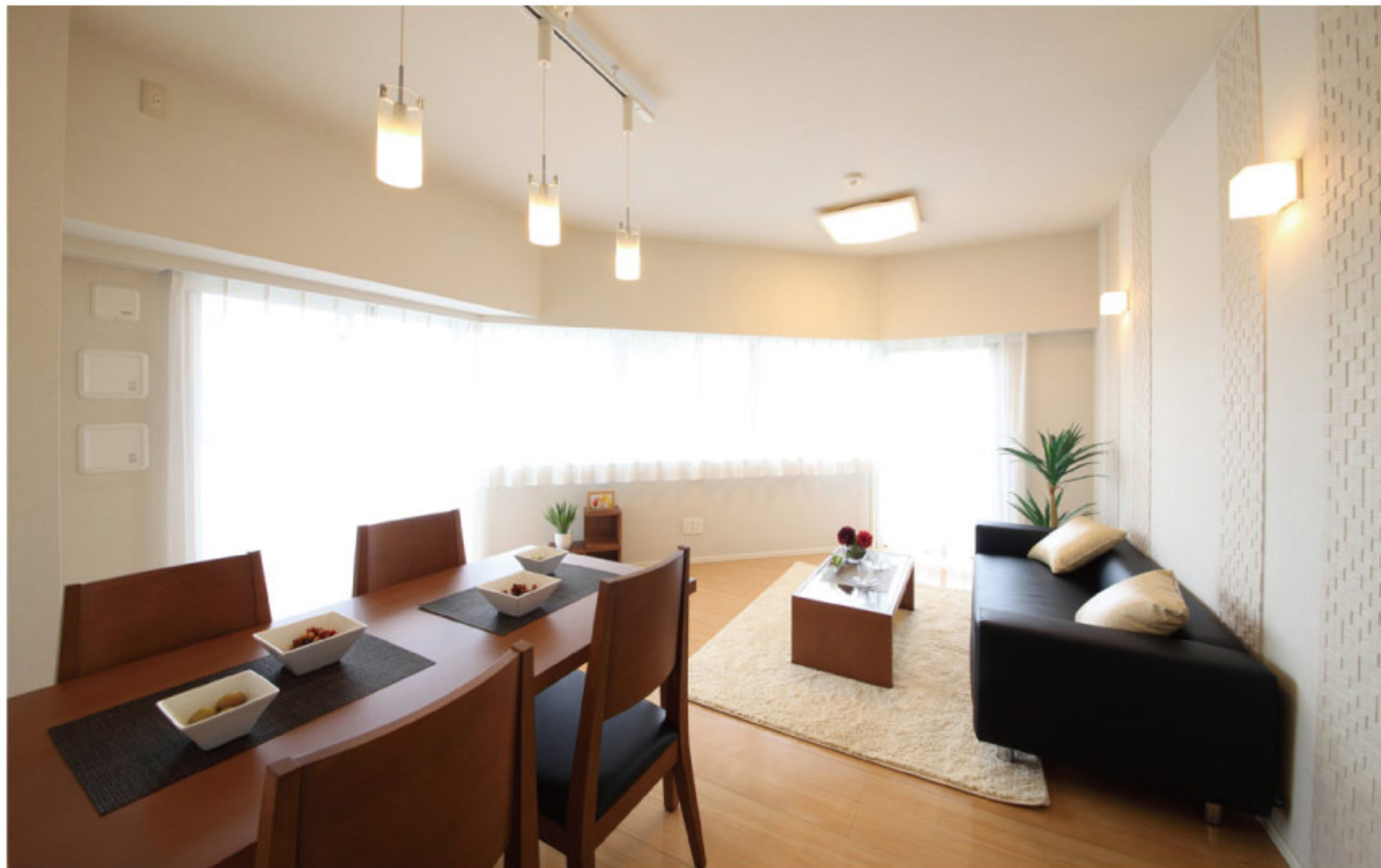
【イメージ写真】写真は一例ですので実際のものとは異なる場合があります。

旧野村不動産(株)分譲マンション!! スーパー等周辺に買物施設が揃った便利な立地です!!