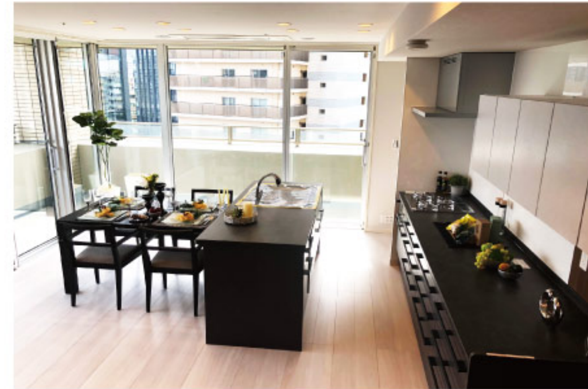
リビング・ダイニング・キッチン(約17.5畳)