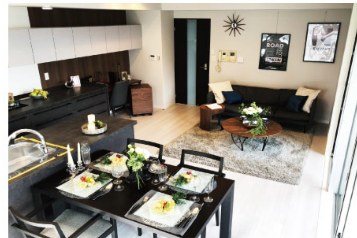
リビング・ダイニング・キッチン(約17.5畳)