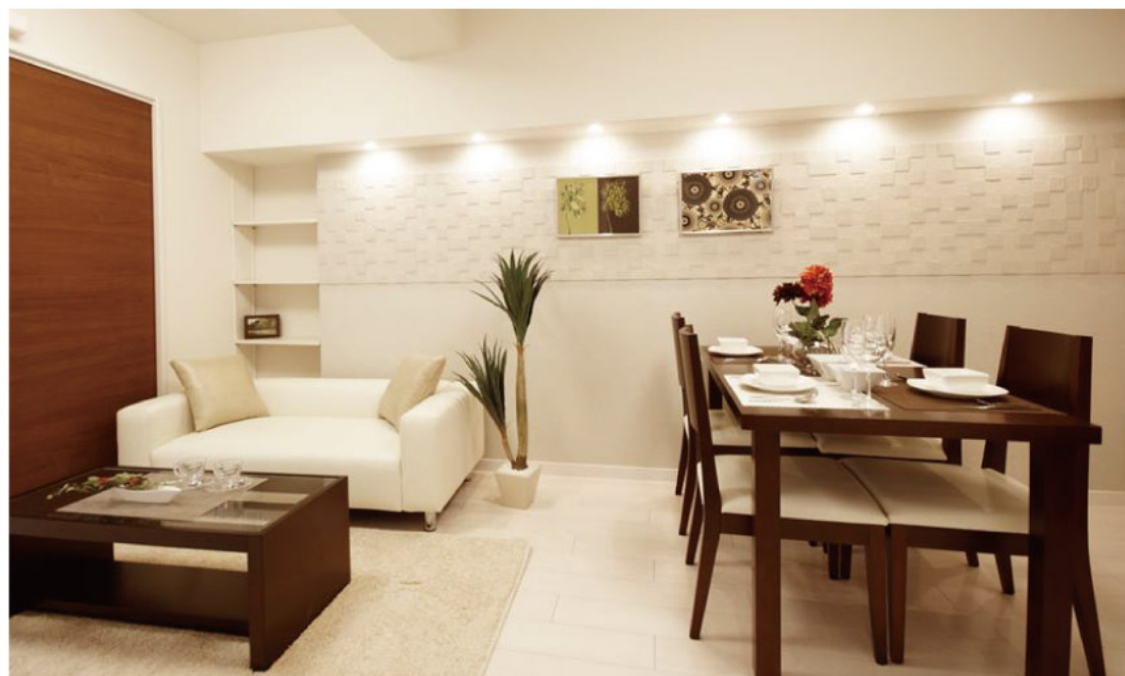
【イメージ写真】写真は家具の一例ですので実際のものとは異なる場合があります。