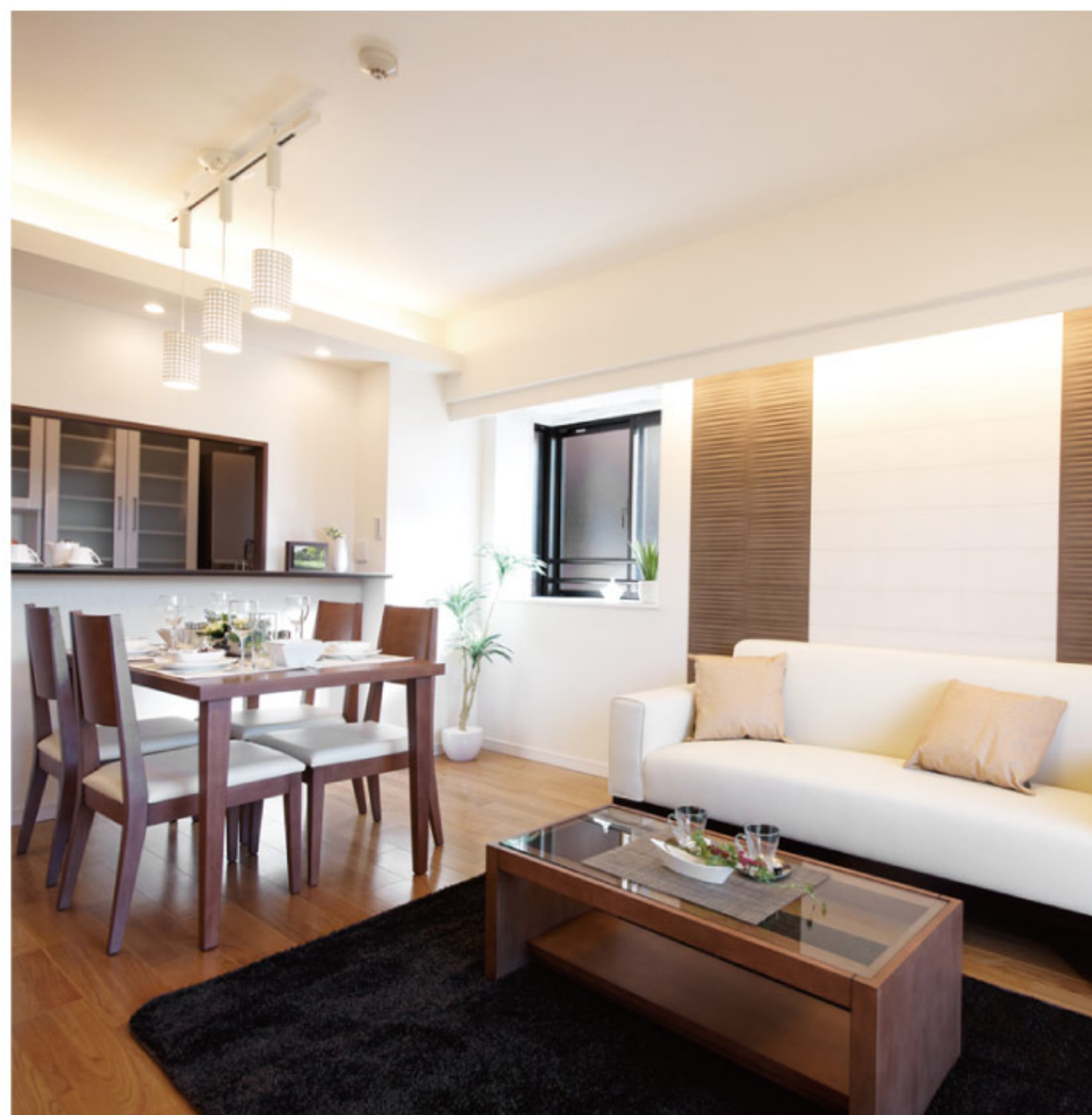
【イメージ写真】写真は家具の一例ですので実際のものとは異なる場合があります。

部屋位置は甲州街道へは向いておりません 都営新宿線直通!京王新線始発駅につき交通至便