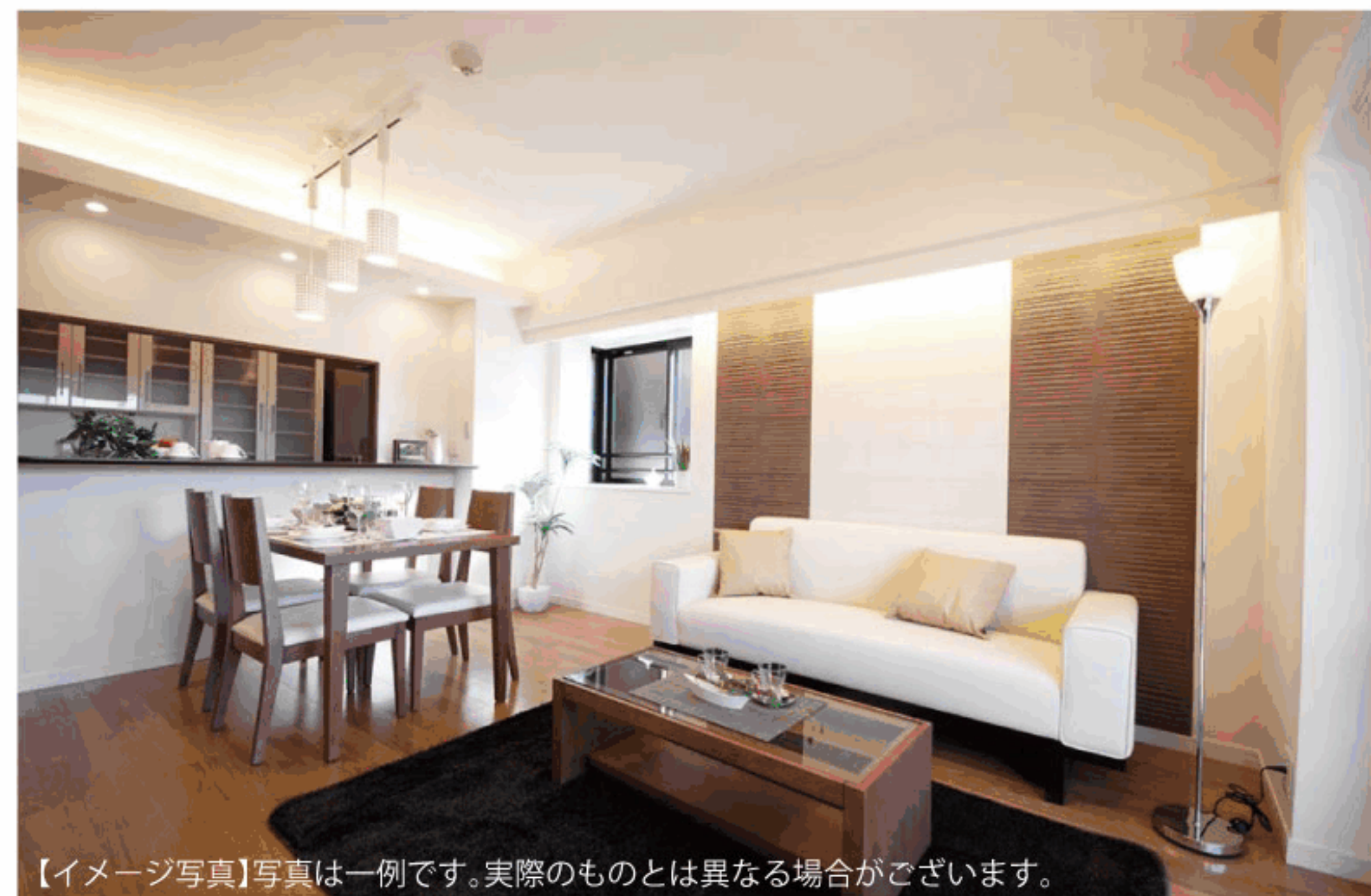
【イメージ写真】写真は一例です。実際のものとは異なる場合がございます。