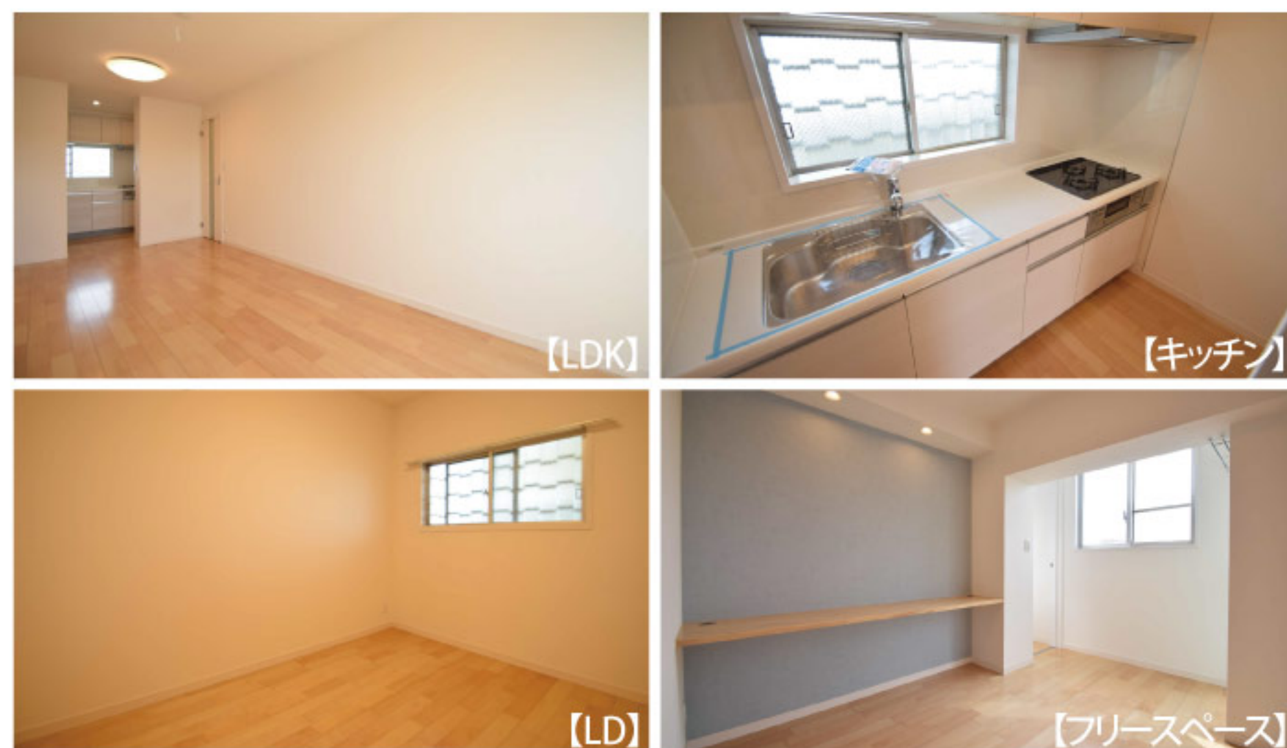
【イメージ写真】写真は一例ですので実際のものとは異なる場合があります。

当住宅は、リノベーション住宅推進協議会の定める 適合リノベーション住宅のR1基準(マンション専有部内の 給排水管などの重要インフラに検査を行い、2年以上の保証 および住宅履歴が付帯)を満たした「R1住宅」です。