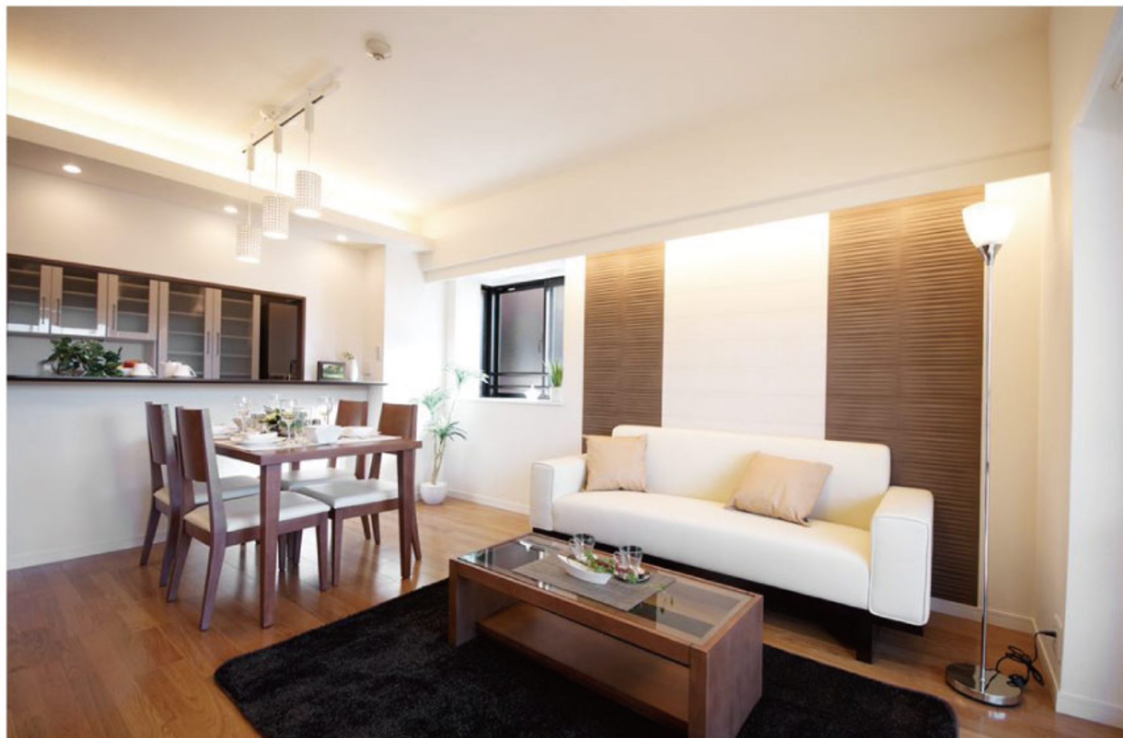
【イメージ写真】写真は一例です。実際のものとは異なる場合がございます。