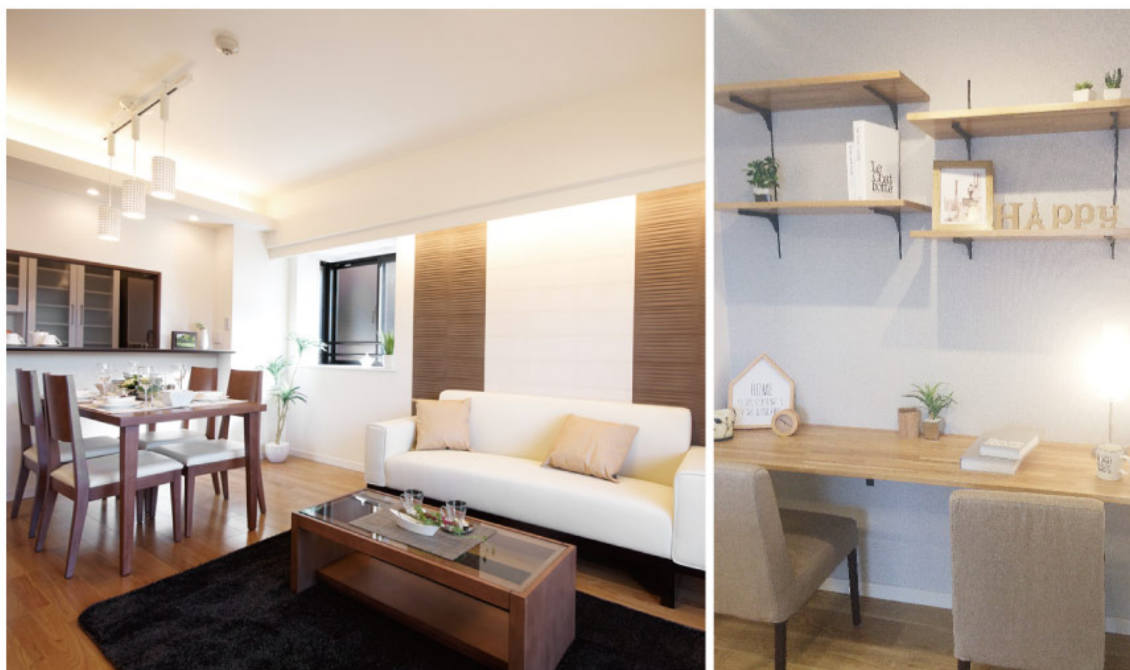
【イメージ写真】写真は家具の一例ですので実際のものとは異なる場合があります。

通勤・通学、お買い物に便利な「西葛西」駅徒歩2分 8階建ての7階により、採光、眺望、通風、大変良好です。