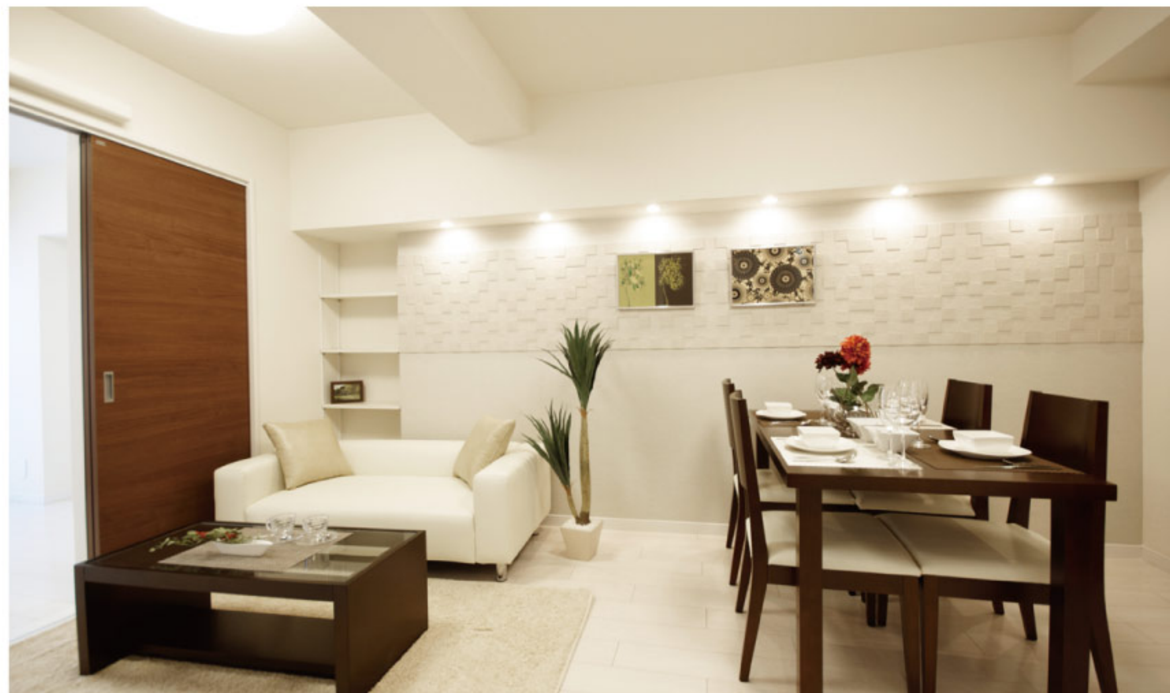
【イメージ写真】写真は家具の一例ですので実際のものとは異なる場合があります。

敷地内公園が在り緑に囲まれた部屋! 全総戸数408戸のビックコミュニティ!老若男女幅広い世代が暮らし、住環境良好★