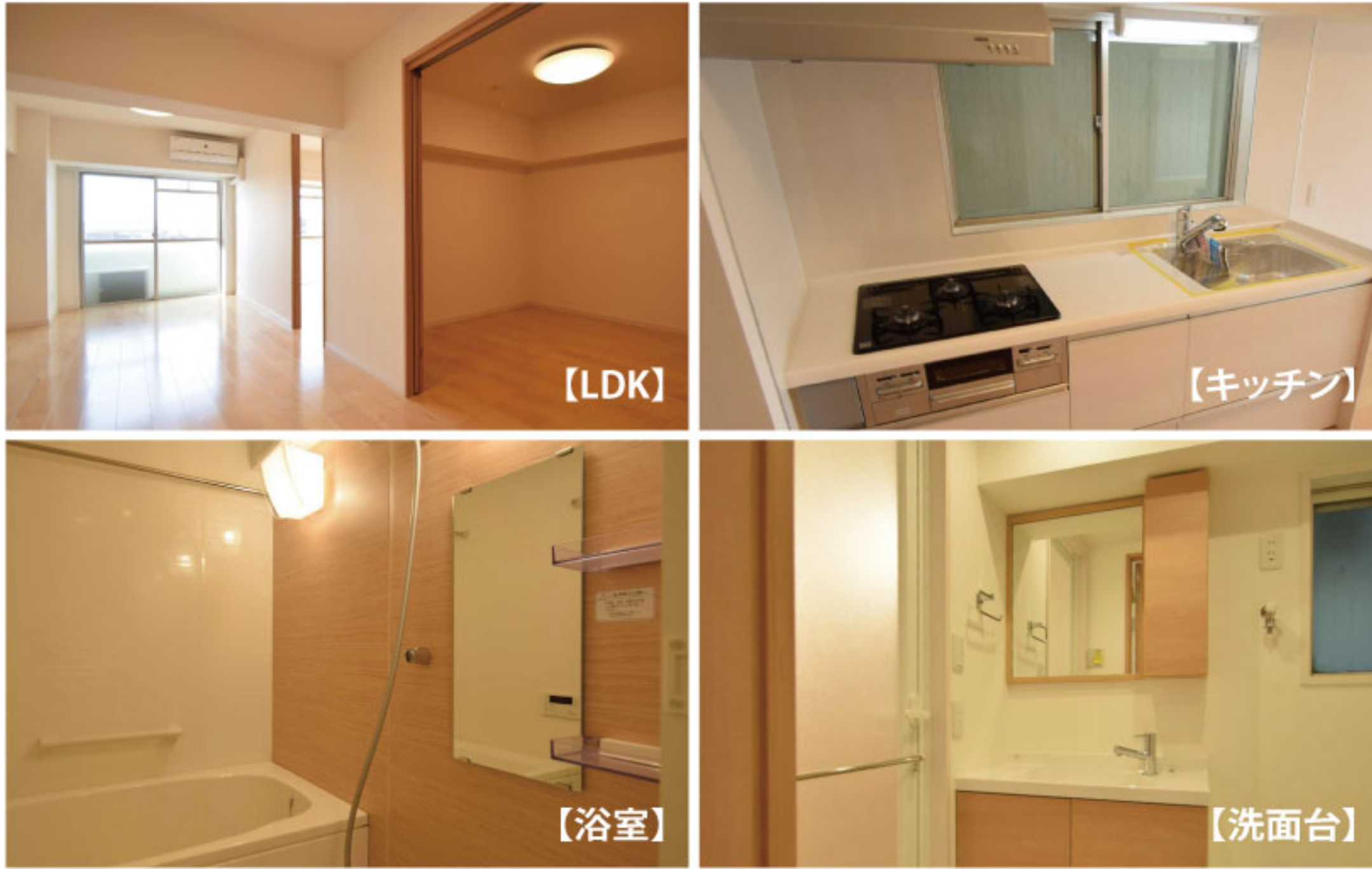
【イメージ写真】写真は家具の一例ですので実際のものとは異なる場合があります。