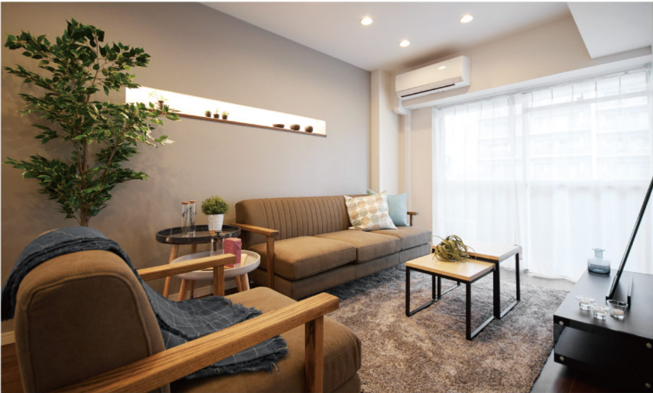
【イメージ写真】写真は一例ですので実際のものとは異なる場合があります。

都営新宿線急行停車「大島」駅徒歩2分! 深夜まで営業しているスーパーまで約25m!