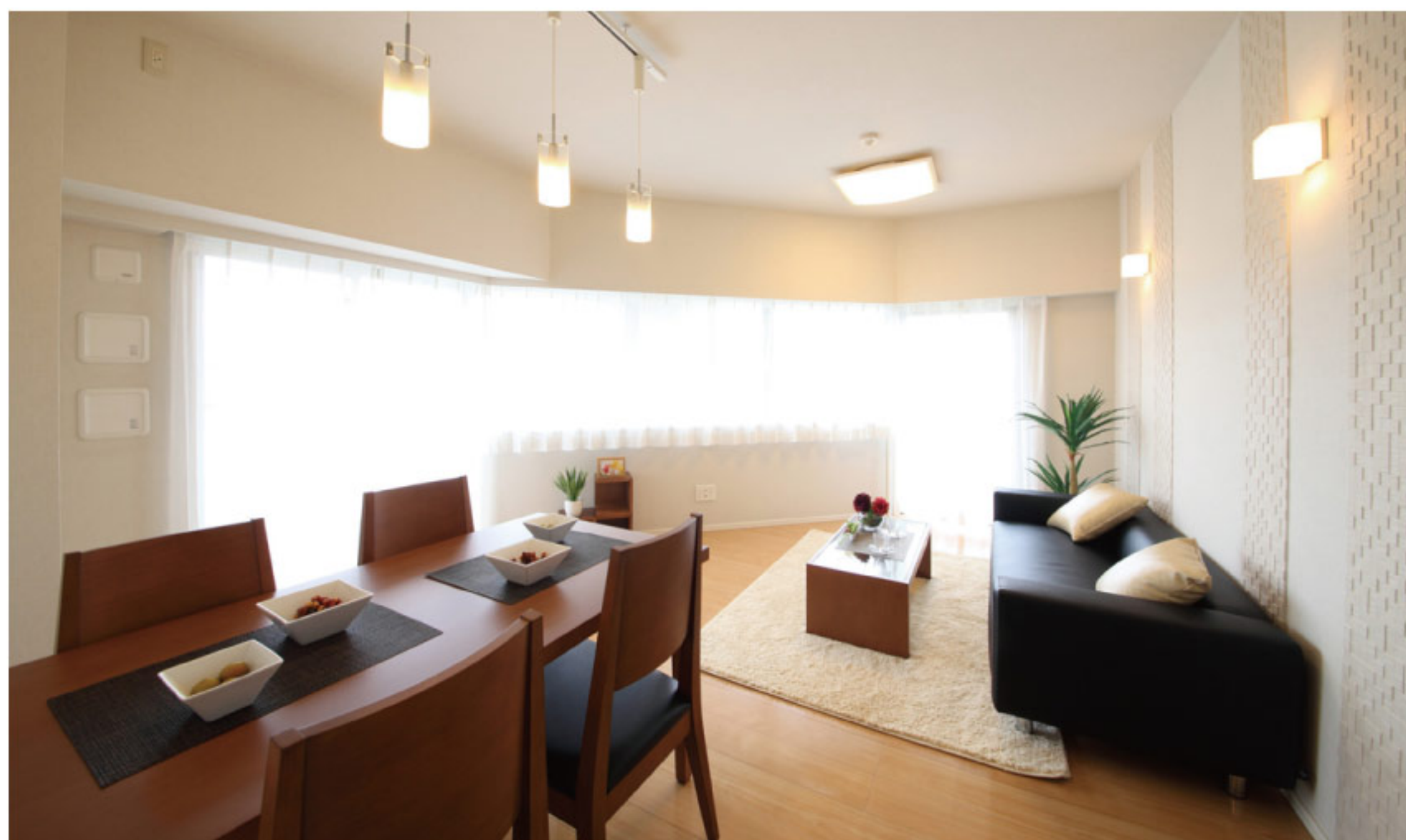
【イメージ写真】写真は一例ですので実際のものとは異なる場合があります。