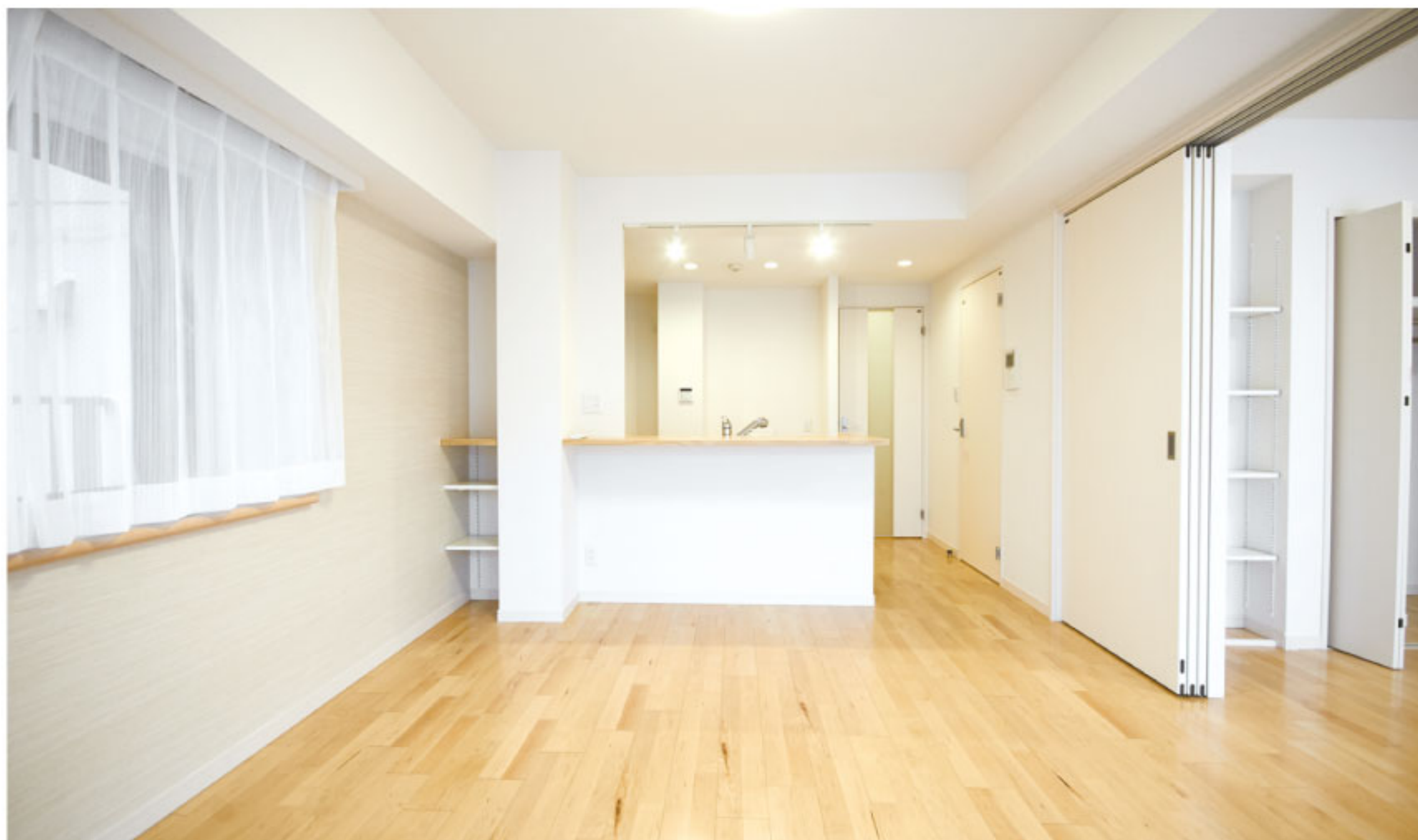
【イメージ写真】写真は一例ですので実際のものとは異なる場合があります。