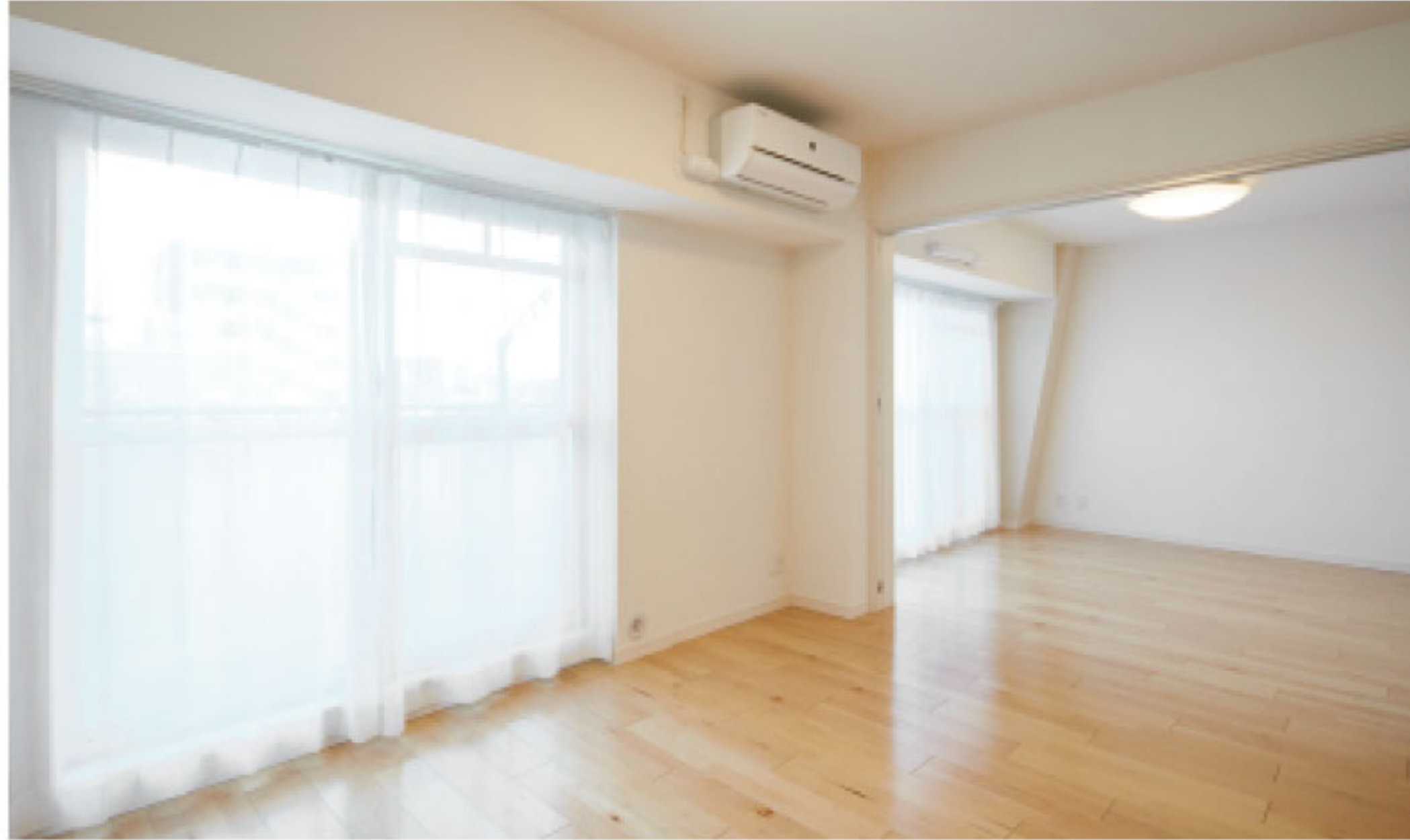
【イメージ写真】写真は一例ですので実際のものとは異なる場合があります。

当住宅は、リノベーション住宅推進協議会の定める 適合リノベーション住宅のR1基準(マンション専有部内の 給排水管などの重要インフラに検査を行い、2年以上の保証 および住宅履歴が付帯)を満たした<R1住宅>です。