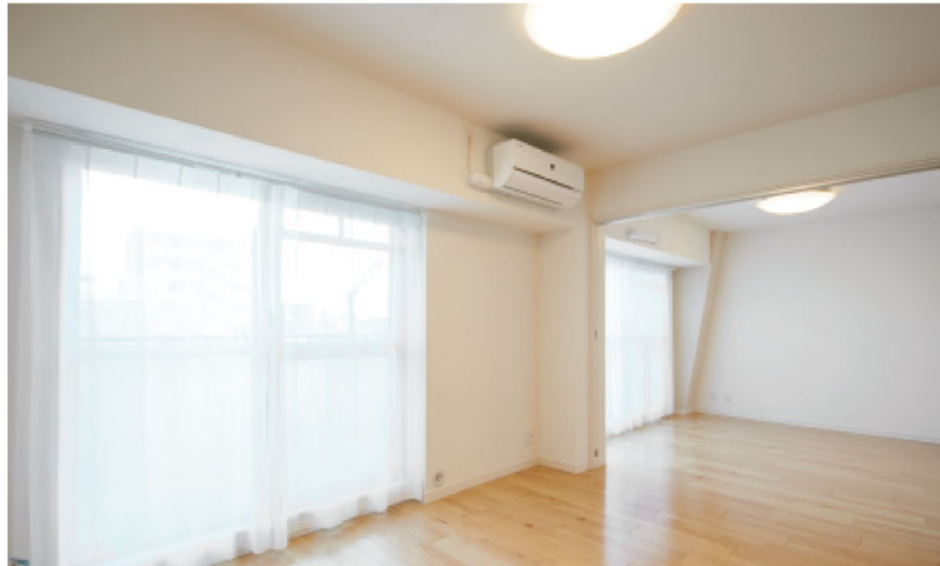
【イメージ写真】写真は一例ですので実際のものとは異なる場合があります。

～駅徒歩5分・暖かな南向き・プライバシー性のある角住戸～ 安心の有人管理★手頃なランニングコスト★アリオ西新井も近く