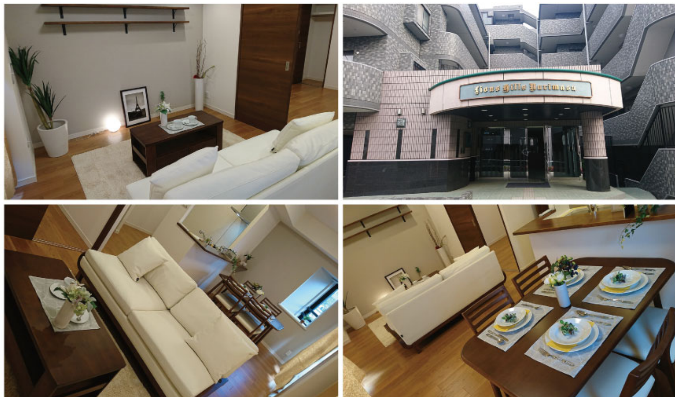
【イメージ写真】写真は家具の一例ですので実際のものとは異なる場合があります。

管理体制良好マンション◎オートロック・ホームセキュリティーシステム付き!! 南西向きにつき陽当たり良好です♪