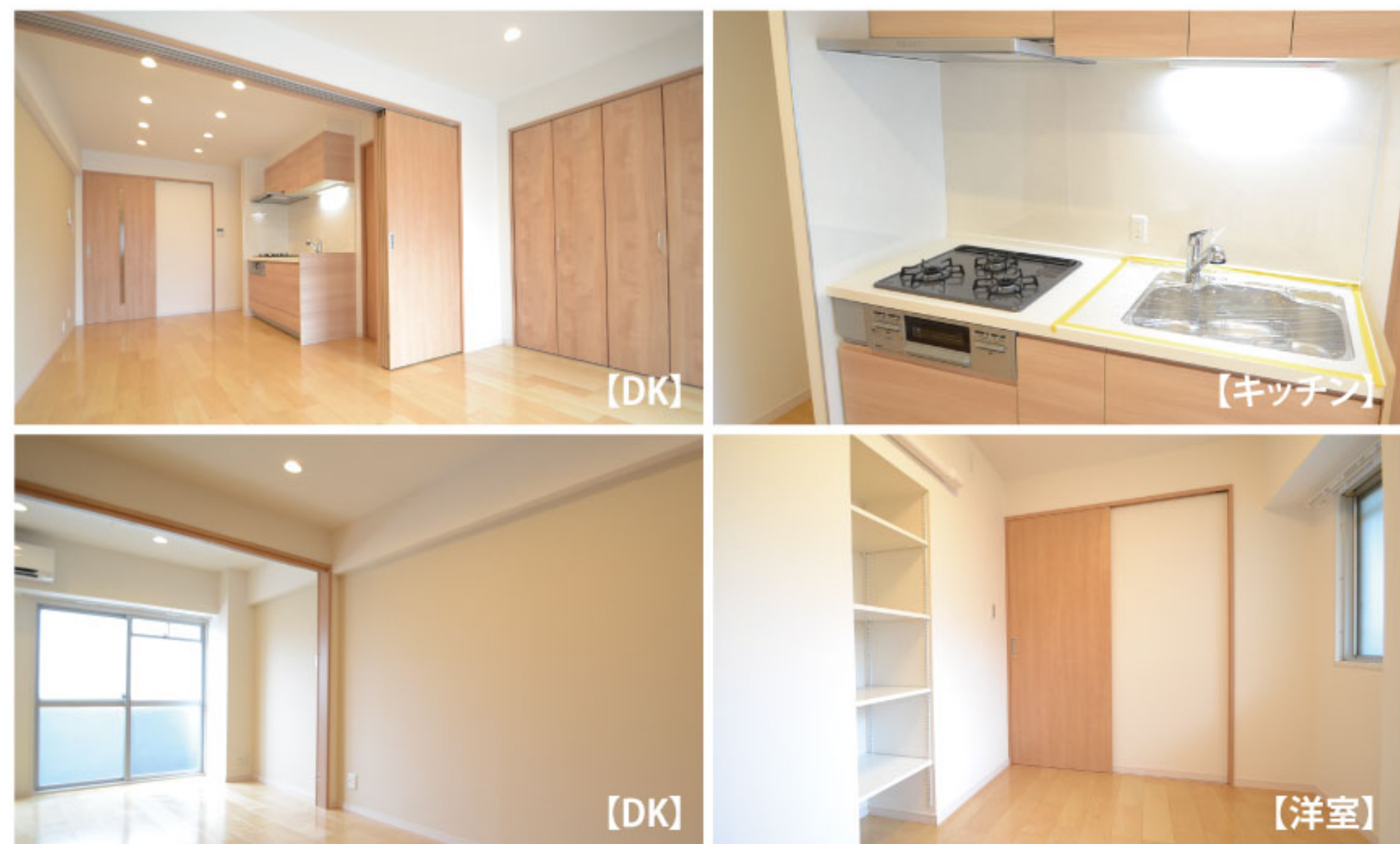
【イメージ写真】写真は家具の一例ですので実際のものとは異なる場合があります。

当住宅は、リノベーション住宅推進協議会の定める 適合リノベーション住宅のR1基準(マンション専有部内の 給排水管などの重要インフラに検査を行い、2年以上の保証 および住宅履歴が付帯)を満たした<R1住宅>です。