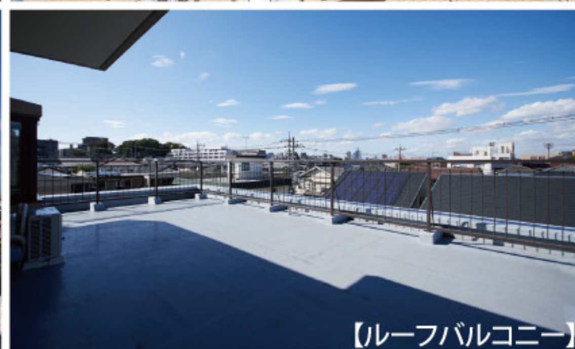
[ルーフバルコニー]