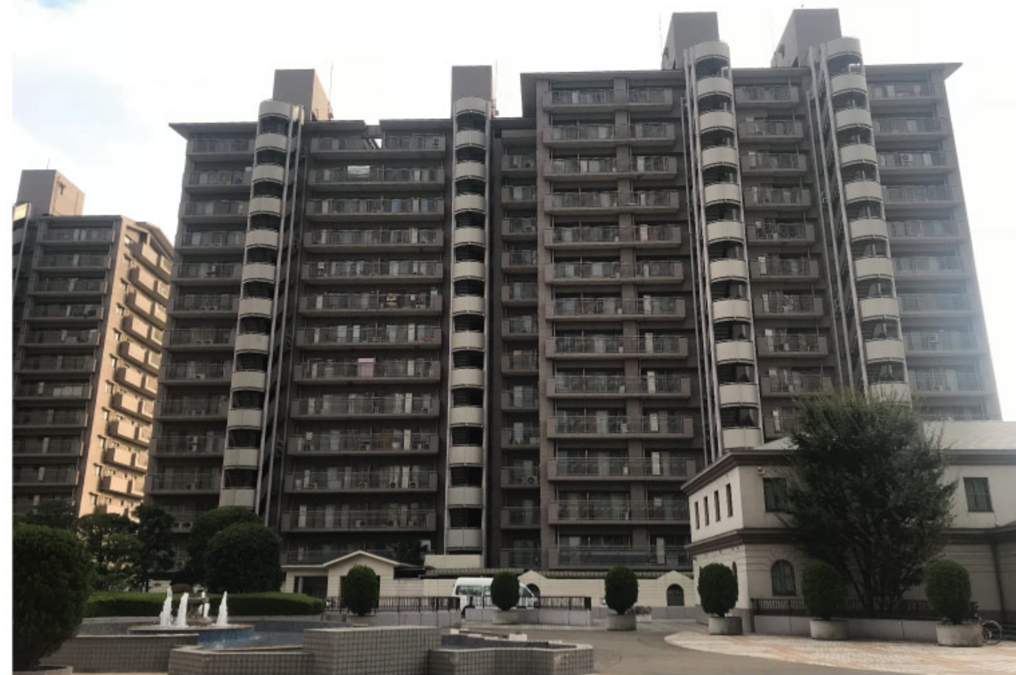
【イメージ写真】写真は一例ですので実際のものとは異なる場合があります。