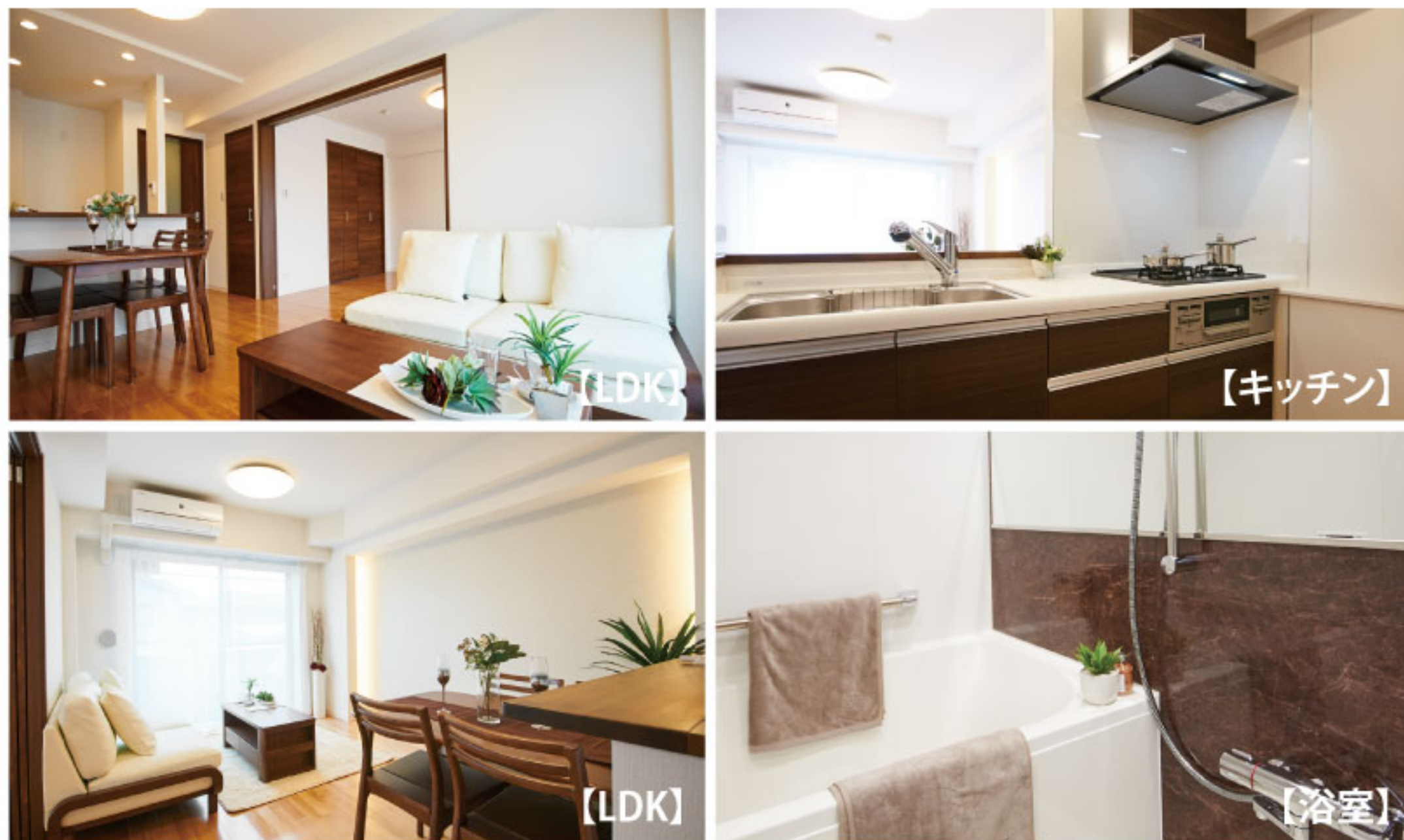
【イメージ写真】写真は家具の一例ですので実際のものとは異なる場合があります。

当住宅は、リノベーション住宅推進協議会の定める 適合リノベーション住宅のR1基準(マンション専有部内の 給排水管などの重要インフラに検査を行い、2年以上の保証 および住宅履歴が付帯)を満たした<R1住宅>です。