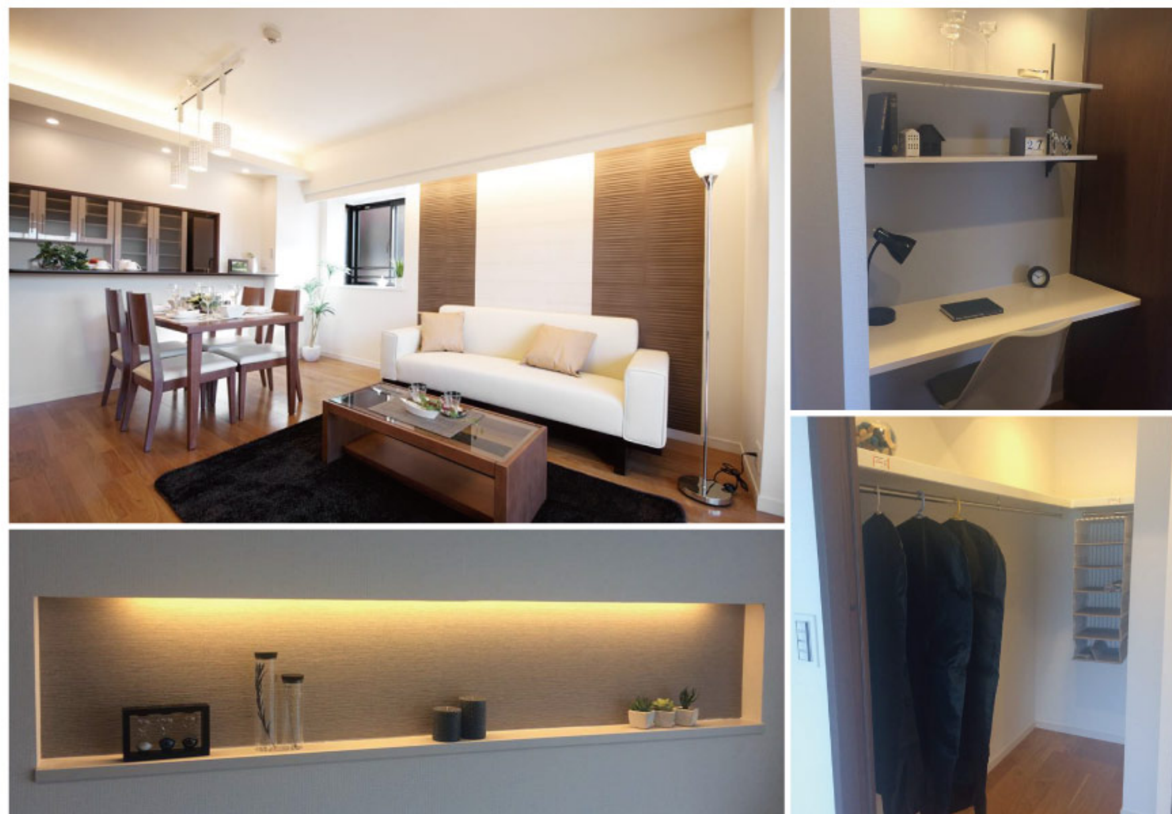
【イメージ写真】写真は一例です。実際のものとは異なる場合がございます。