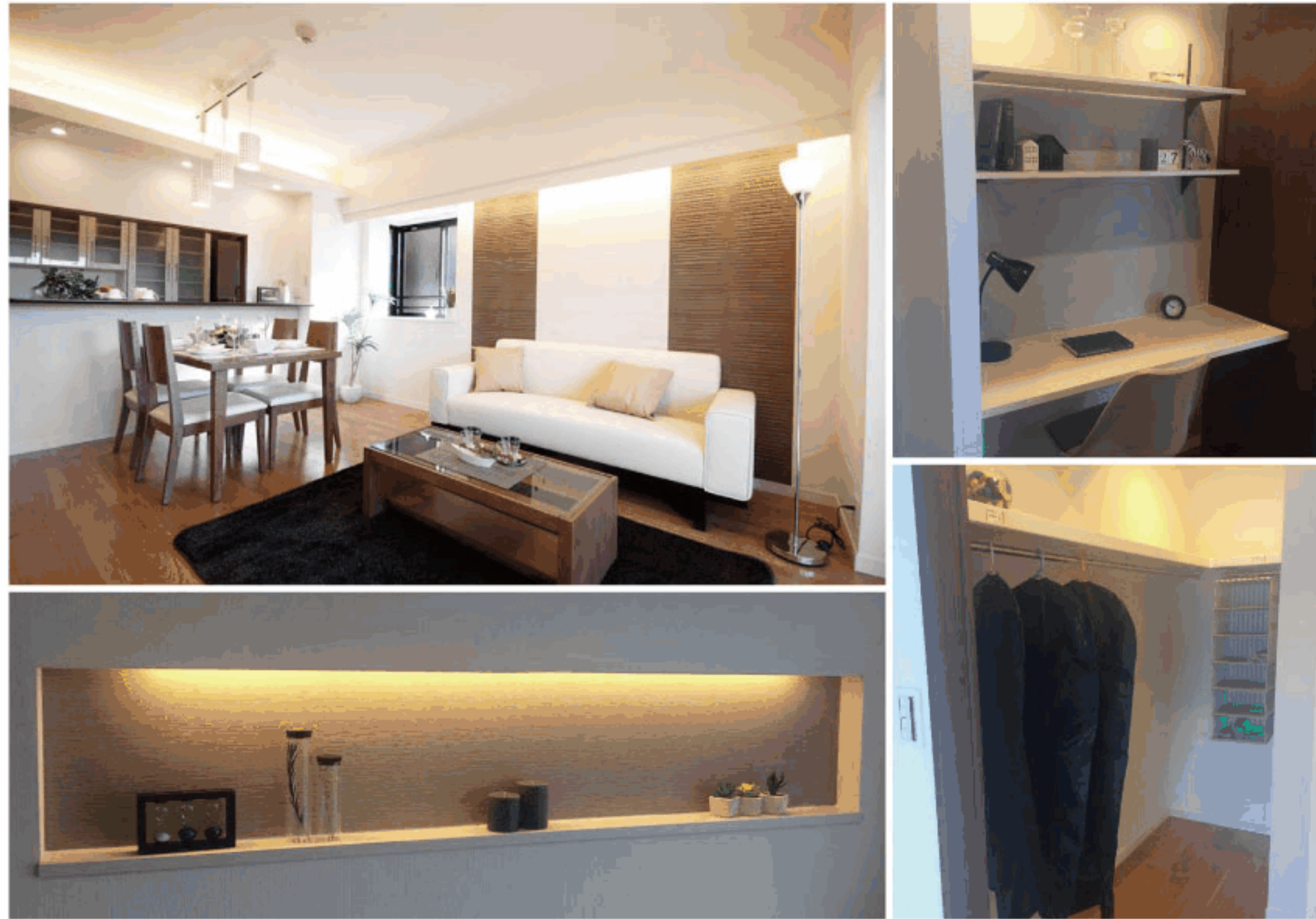
【イメージ写真】写真は一例です。実際のものとは異なる場合がございます。