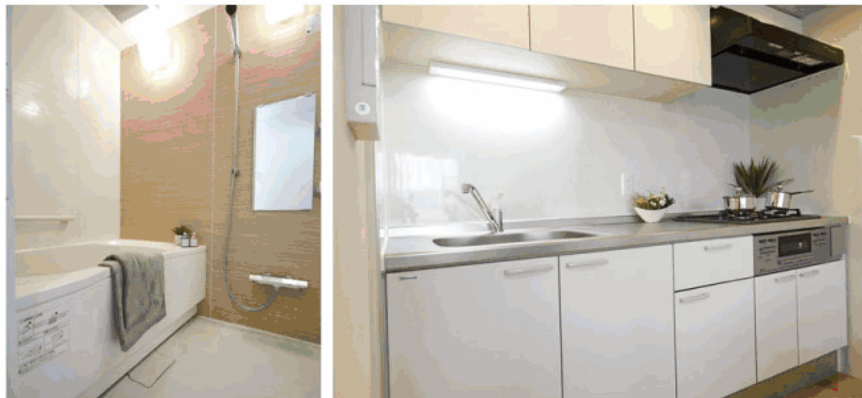
※図面と現状が異なる場合は現状を優先いたします。