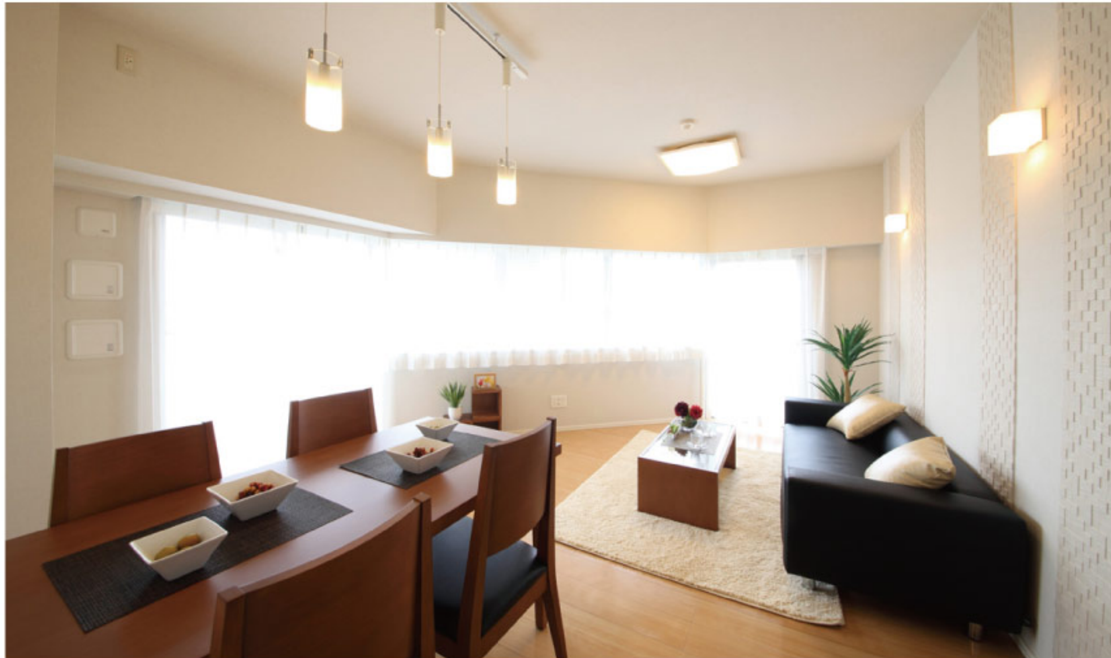
【イメージ写真】写真は家具の一例ですので実際のものとは異なる場合があります。

当住宅は、リノベーション住宅推進協議会の定める 適合リノベーション住宅のR1基準(マンション専有部内の 給排水管などの重要インフラに検査を行い、2年以上の保証 および住宅履歴が付帯)を満たした<R1住宅>です。