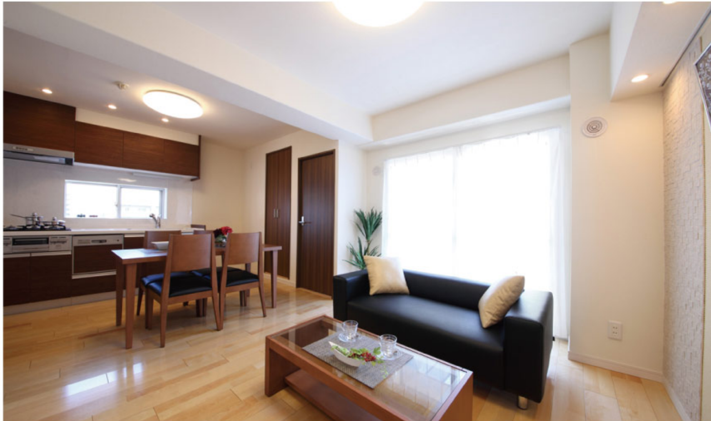
【イメージ写真】写真は家具の一例ですので実際のものとは異なる場合があります。

当住宅は、リノベーション住宅推進協議会の定める 適合リノベーション住宅のR1基準(マンション専有部内の 給排水管などの重要インフラに検査を行い、2年以上の保証 および住宅履歴が付帯)を満たした<R1住宅>です。