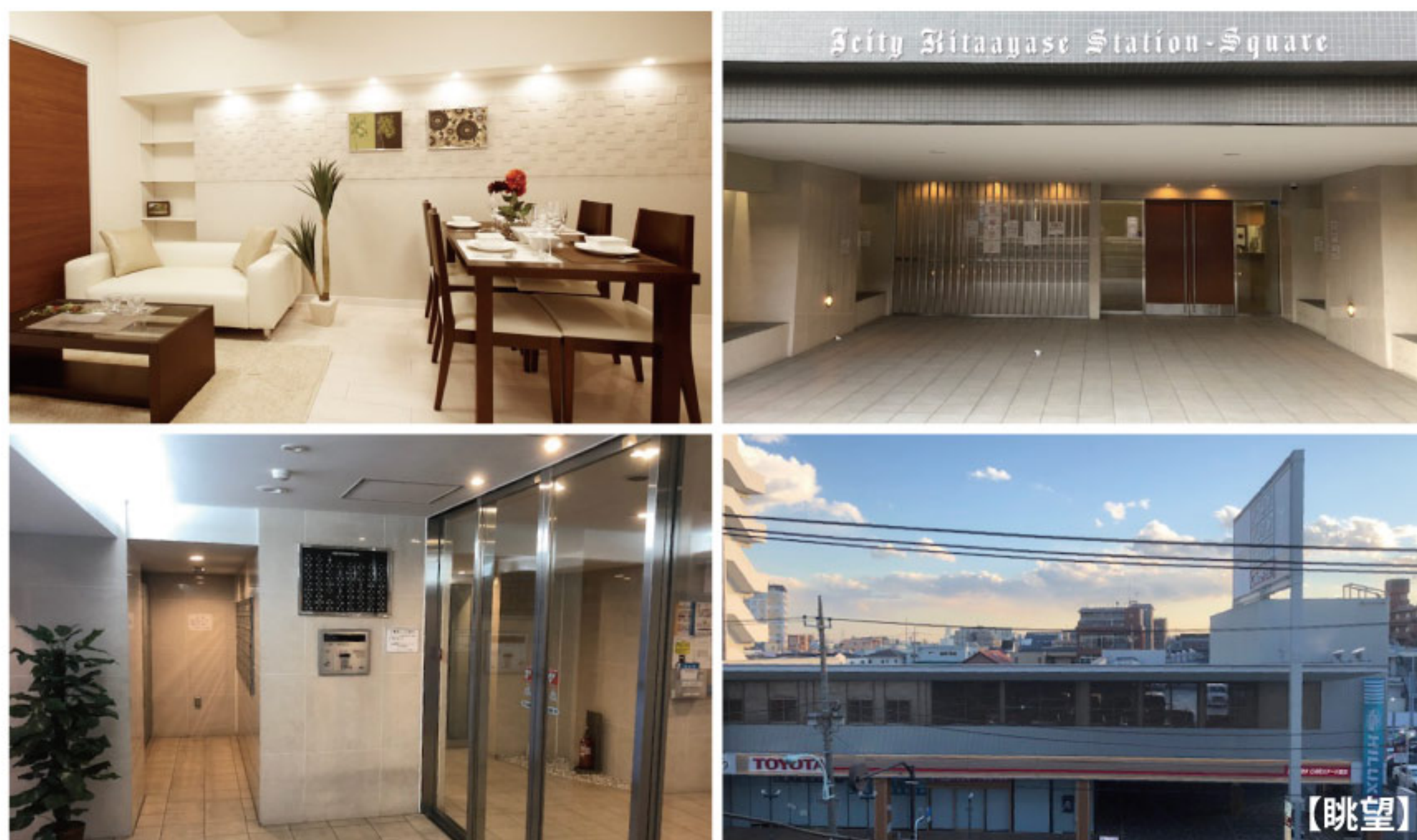
【イメージ写真】写真は家具の一例ですので実際のものとは異なる場合があります。

当住宅は、リノベーション住宅推進協議会の定める 適合リノベーション住宅のR1基準(マンション専有部内の 給排水管などの重要インフラに検査を行い、2年以上の保証 および住宅履歴が付帯)を満たした「R1住宅」です。