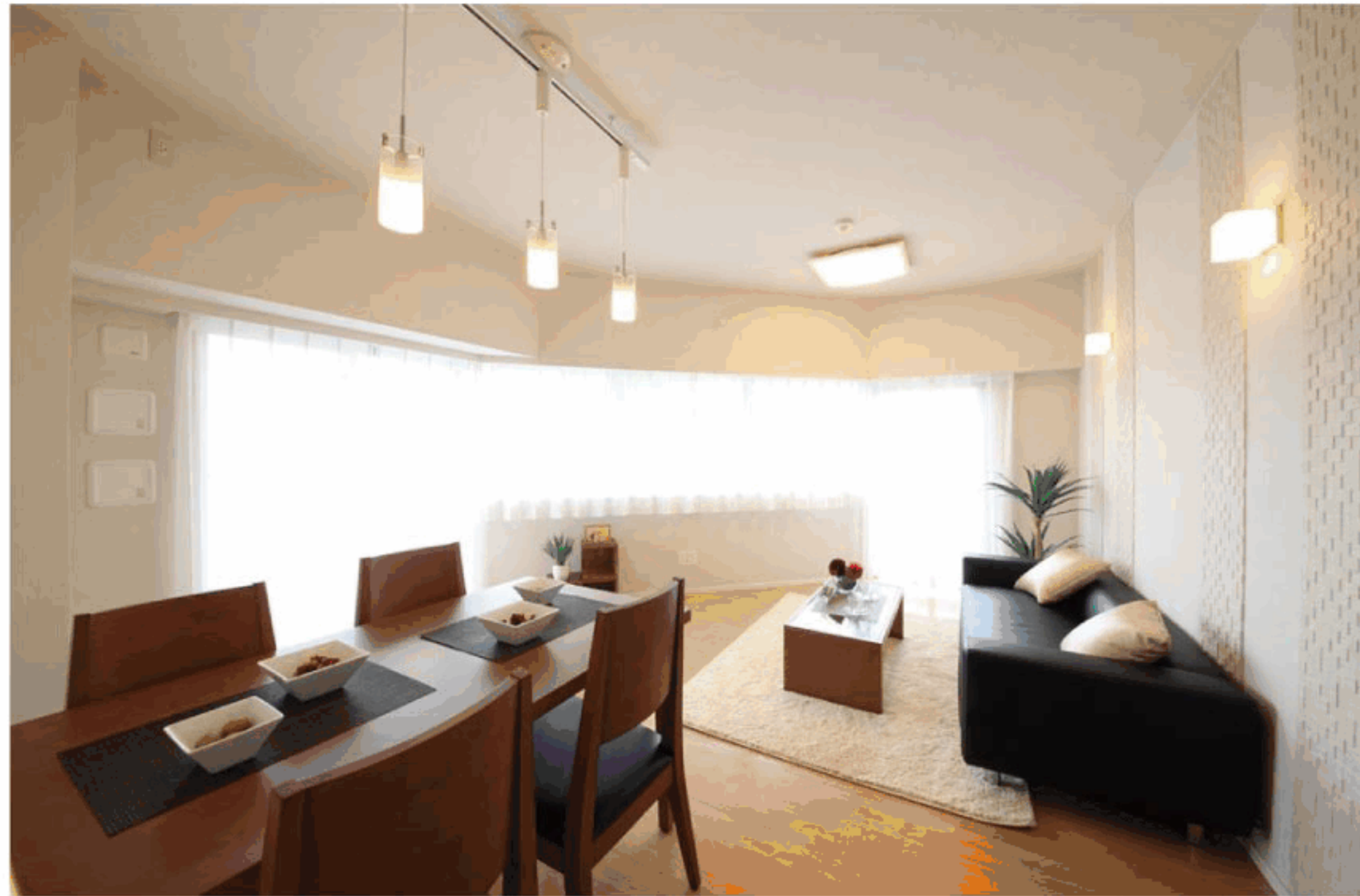
【イメージ写真】写真は一例です。実際のものとは異なる場合がございます。