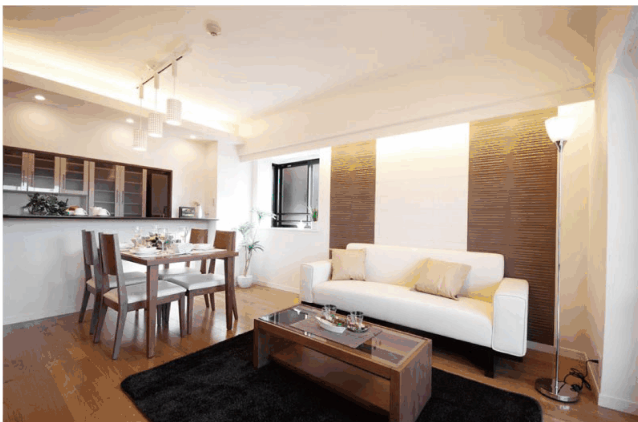
【イメージ写真】写真は一例です。実際のものとは異なる場合がございます。

駅直結のタワーマンション～富士山を望むパノラマ眺望～ 24時間管理人常駐! 管理体制良好♪ペットと一緒に暮らせます