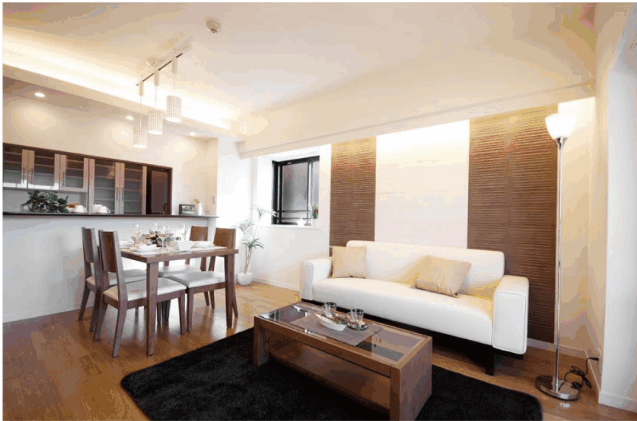
【イメージ写真】写真は一例です。実際のものとは異なる場合がございます。