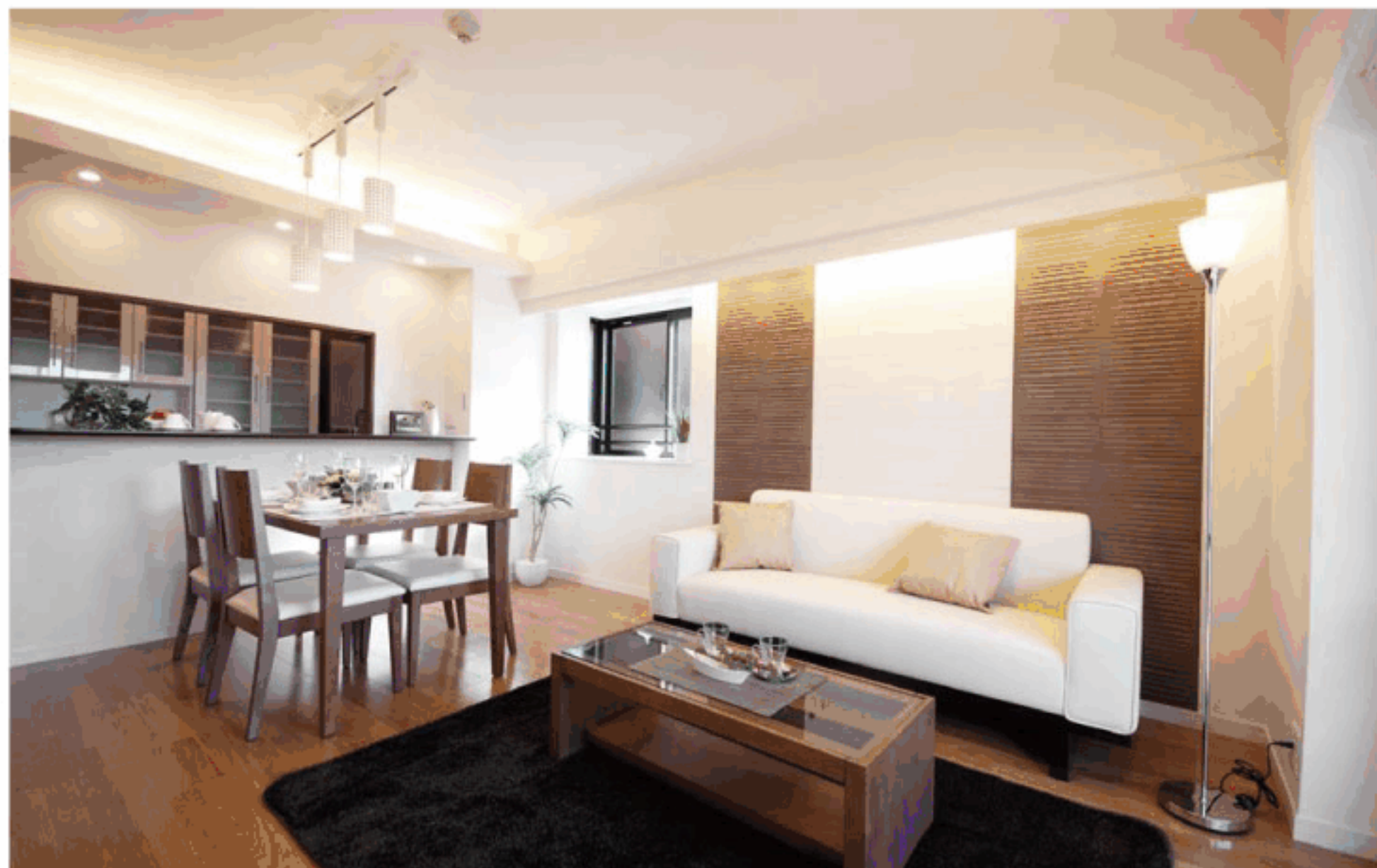
【イメージ写真】写真は一例です。実際のものとは異なる場合がございます。