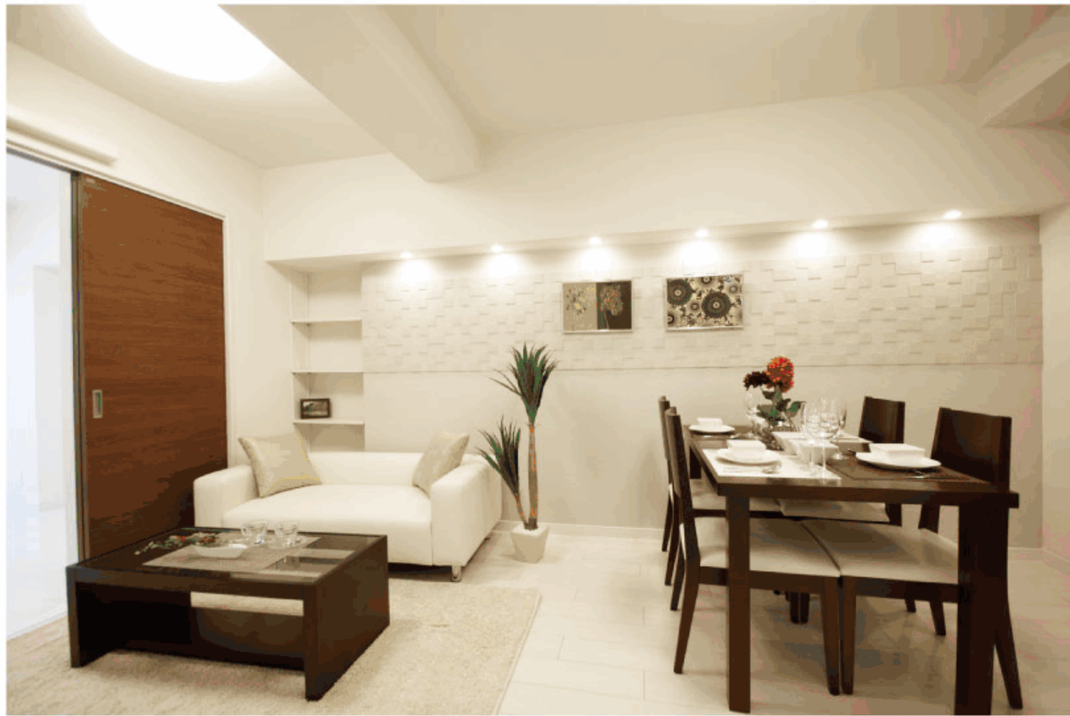
【イメージ写真】写真は一例です。実際のものとは異なる場合がございます。