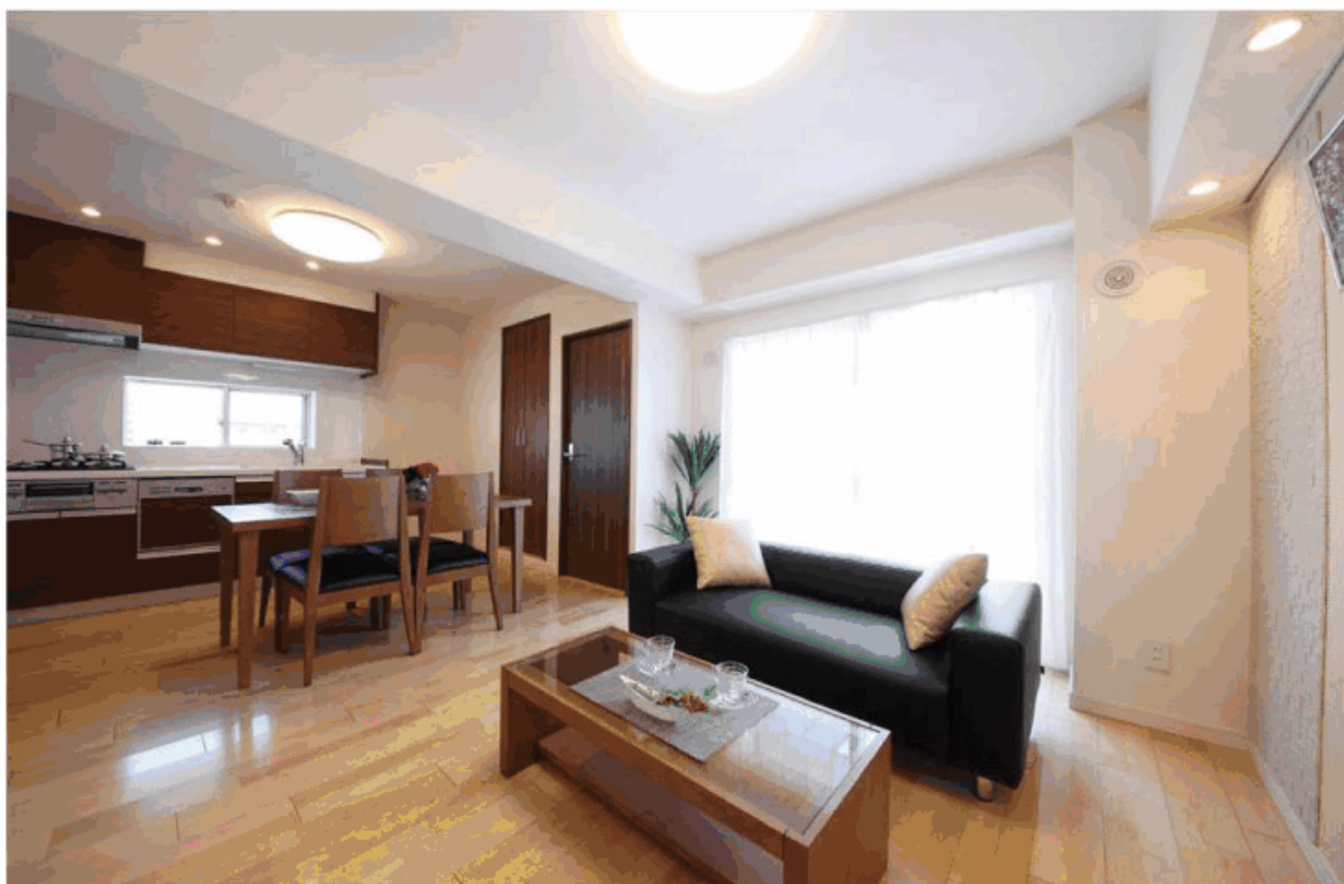
【イメージ写真】写真は一例です。実際のものとは異なる場合がございます。