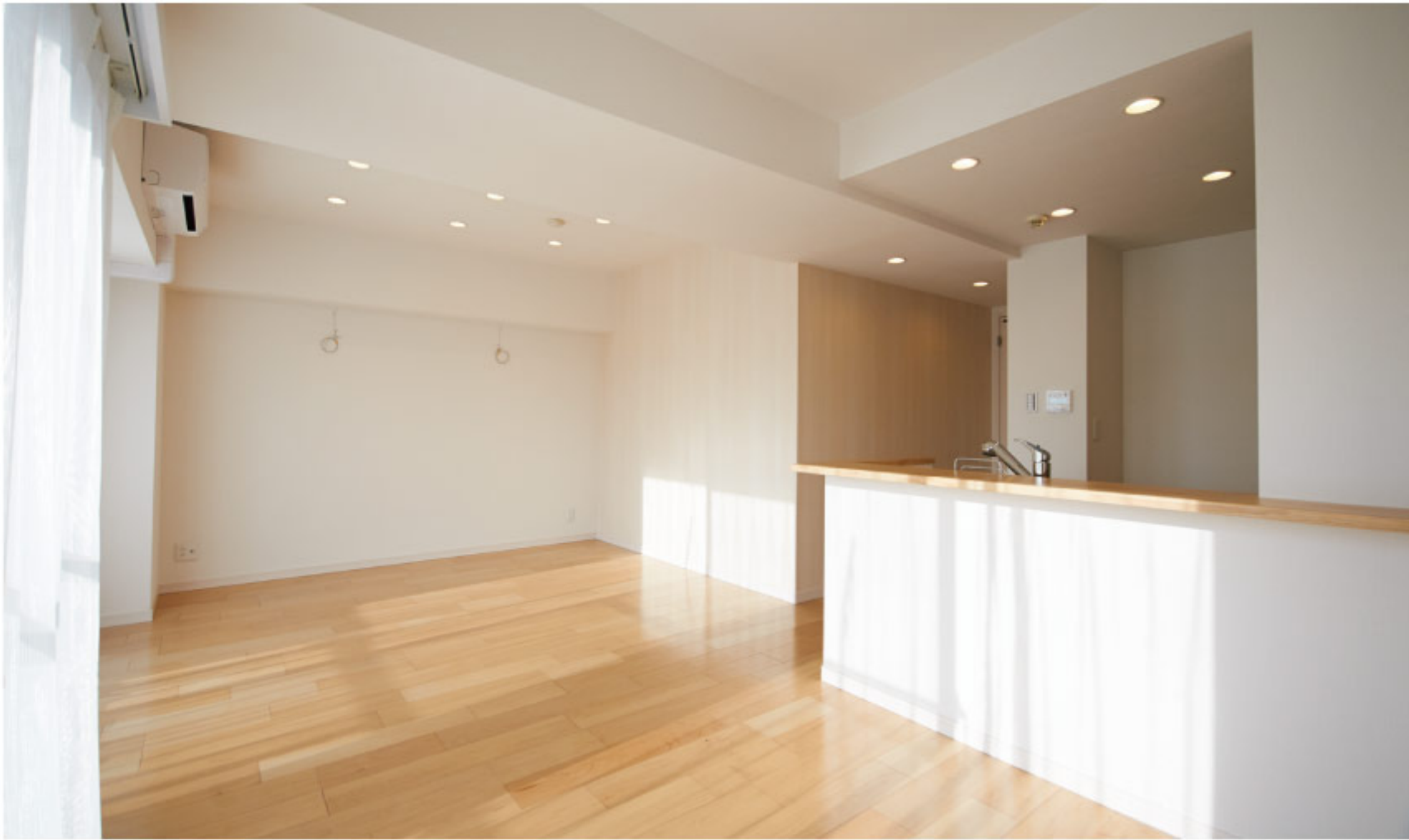
【イメージ写真】写真は一例ですので実際のものとは異なる場合があります。

～エントランスを抜けた先にあるアクアパークが特徴の物件～ 奥行きのあるバルコニー・豊富な収納・広めの浴室・ペットと一緒に暮らせます♪