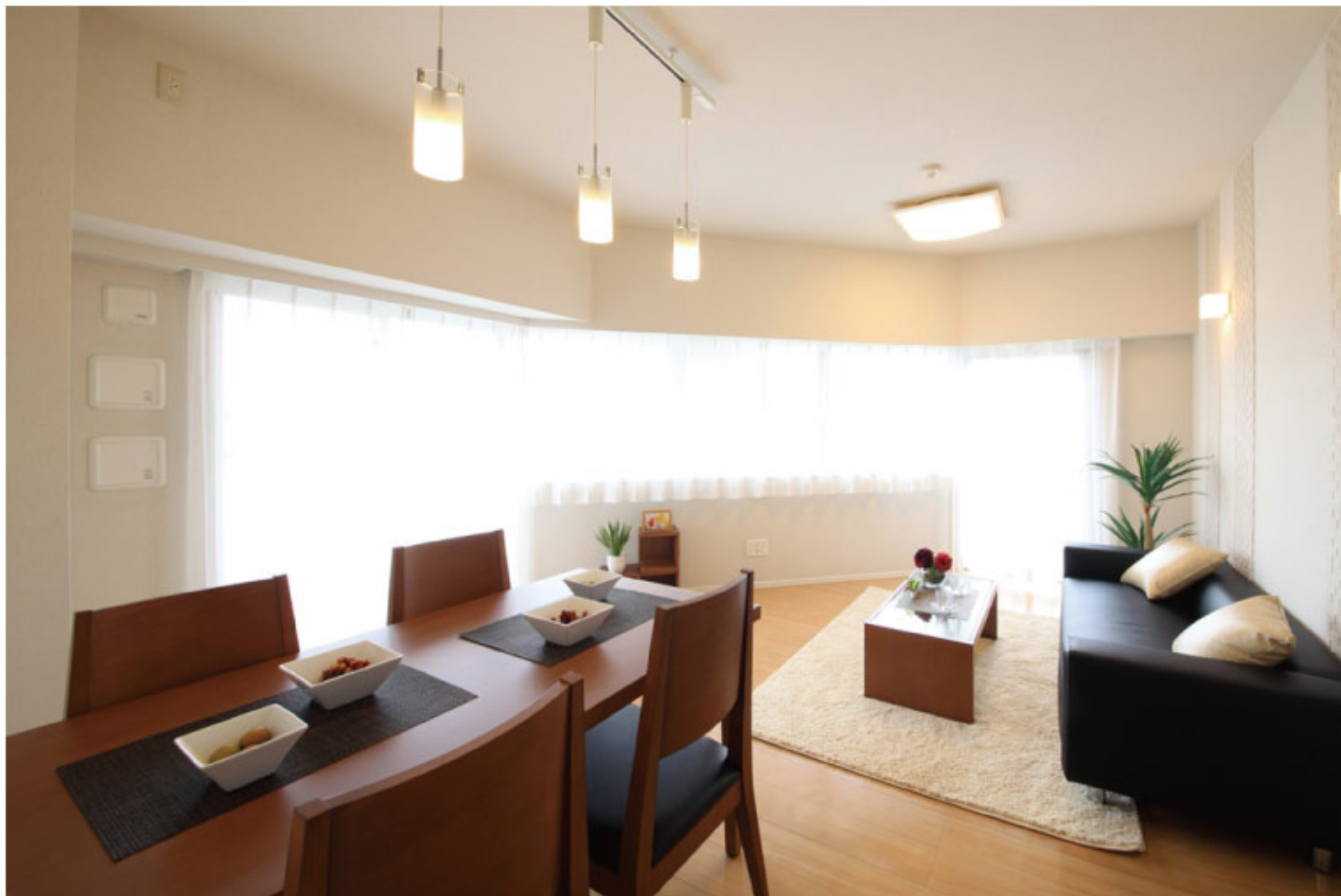
【イメージ写真】写真は家具の一例ですので実際のものとは異なる場合があります。