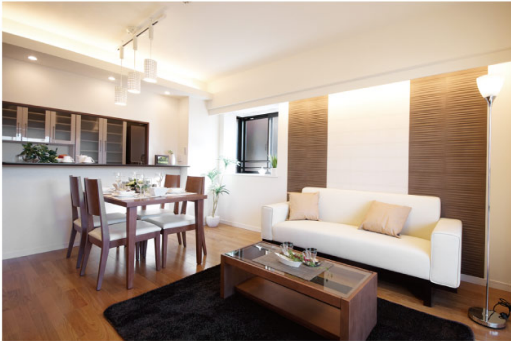
【イメージ写真】写真は家具の一例ですので実際のものとは異なる場合があります。