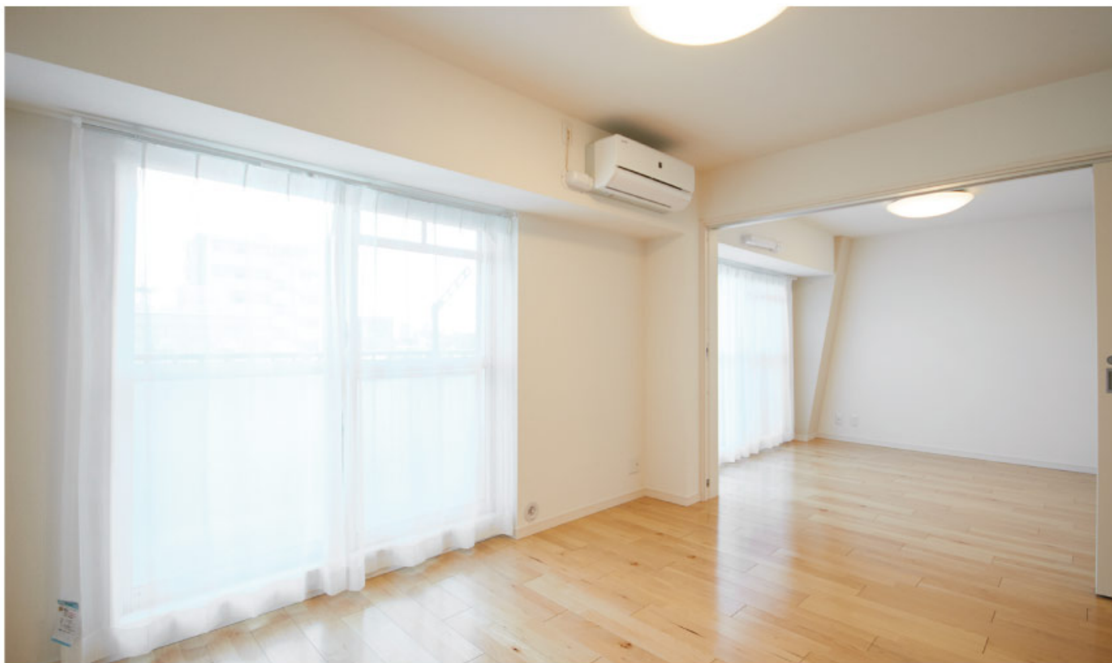
【イメージ写真】写真は家具の一例です。実際のものとは異なる場合があります。