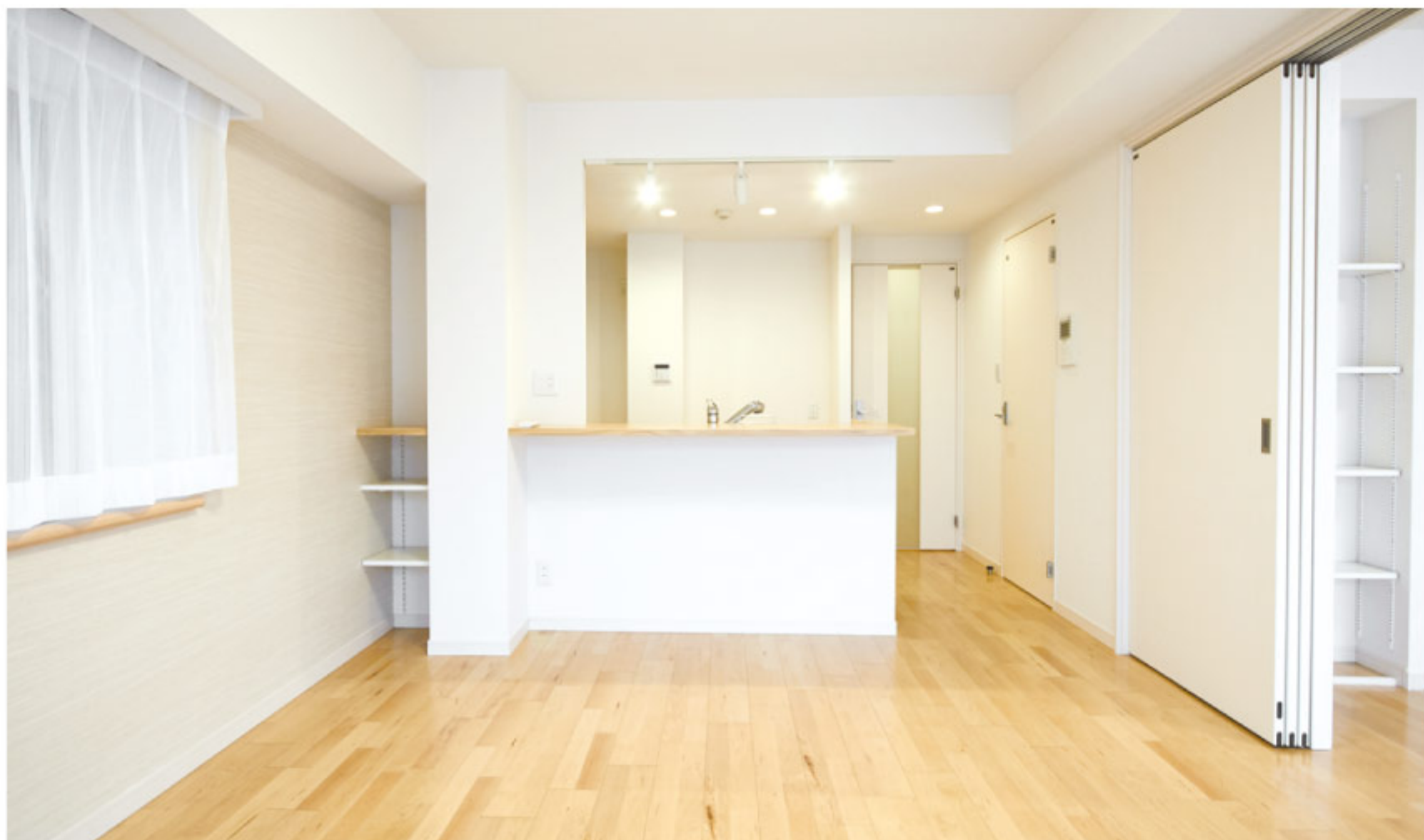
【イメージ写真】写真は一例ですので実際のものとは異なる場合があります。