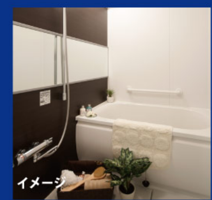
【イメージ写真】 写真は家具の一例ですので実際のものとは異なる場合がございます。