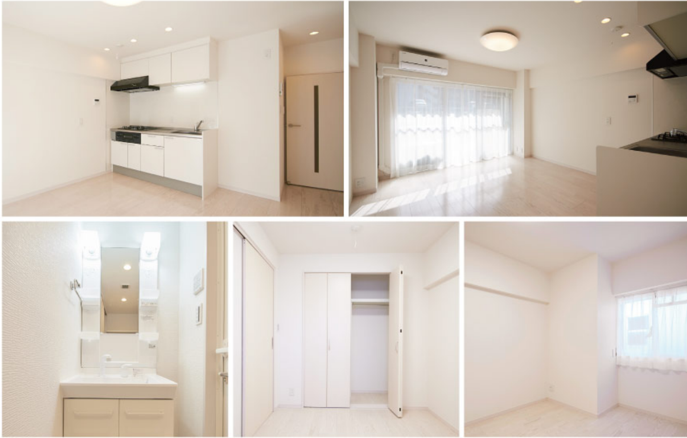
【イメージ写真】写真は家具の一例ですので実際のものとは異なる場合があります。