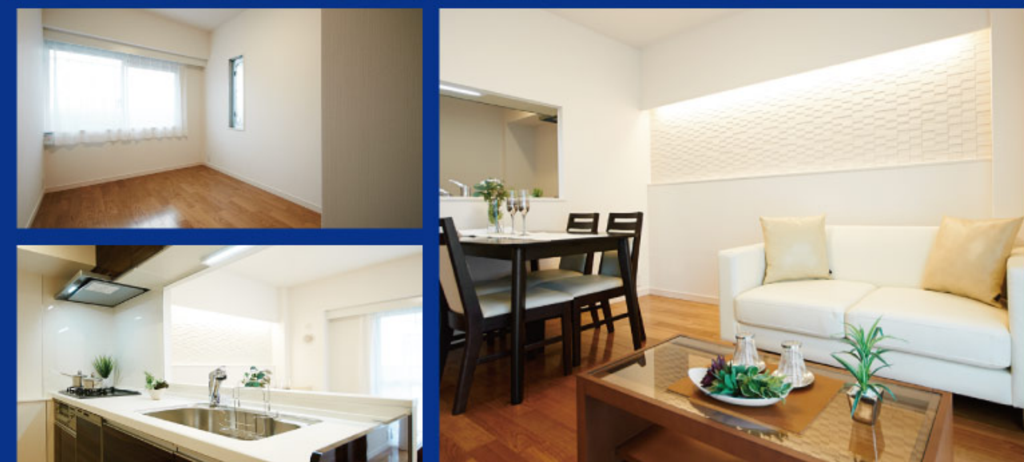
【イメージ写真】写真は家具の一例ですので実際のものとは異なる場合があります。