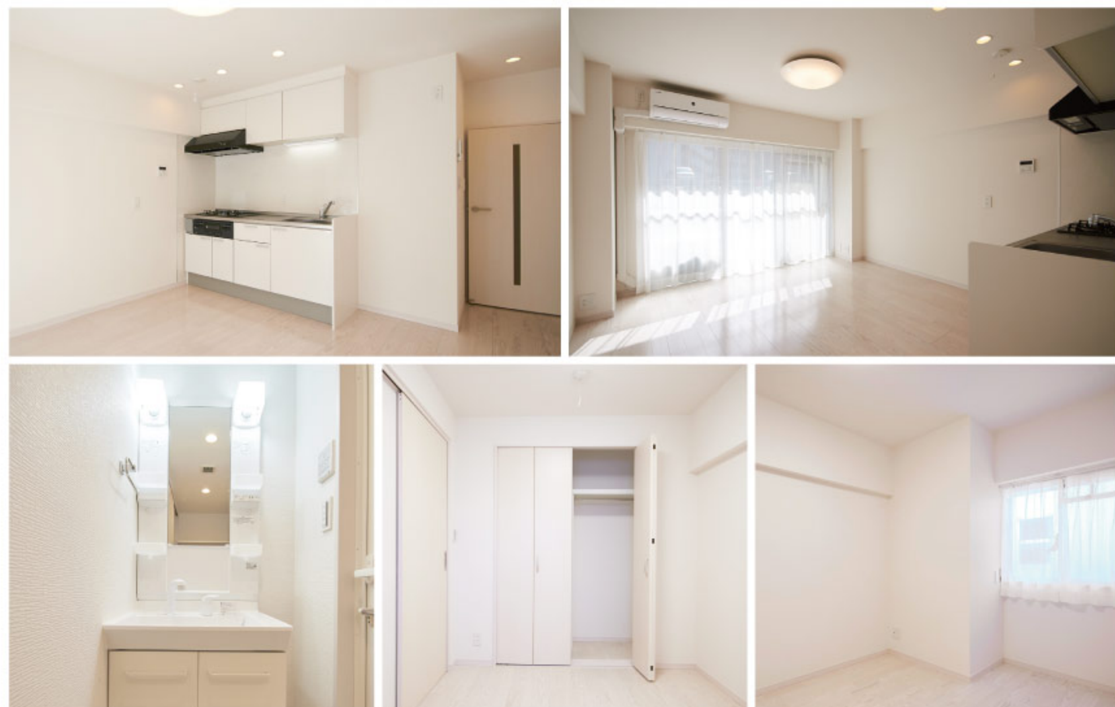
【イメージ写真】写真は家具の一例ですので実際のものとは異なる場合があります。

閑静な住宅地に落ち着いた雰囲気 コンビニ・スーパーも近隣にあり单身者にも利便性良好です