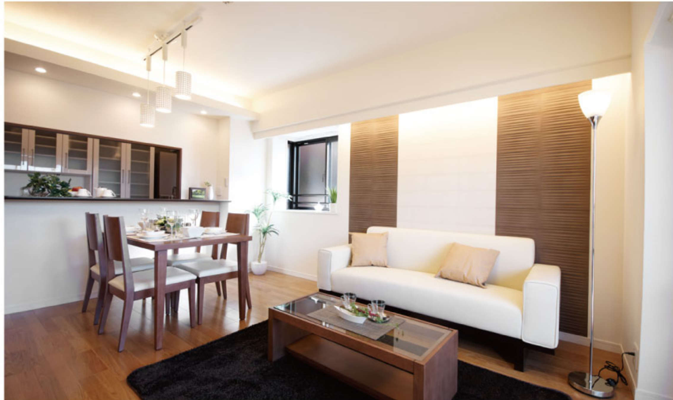
【イメージ写真】写真は家具の一例ですので実際のものとは異なる場合があります。