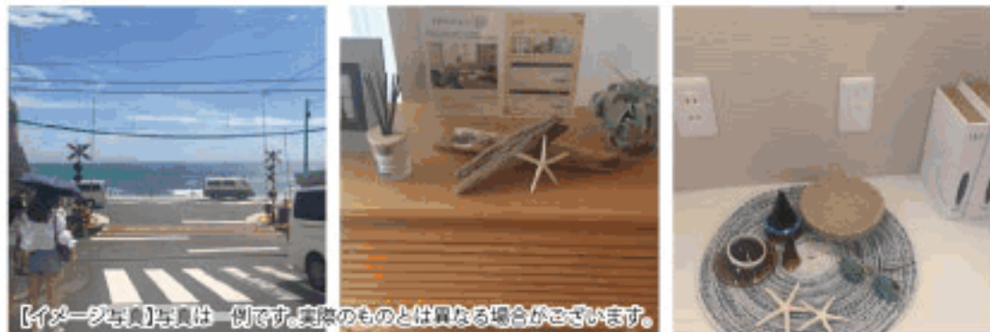
【イメージ写真】写真は一例です。実際のものとは異なる場合がございます。