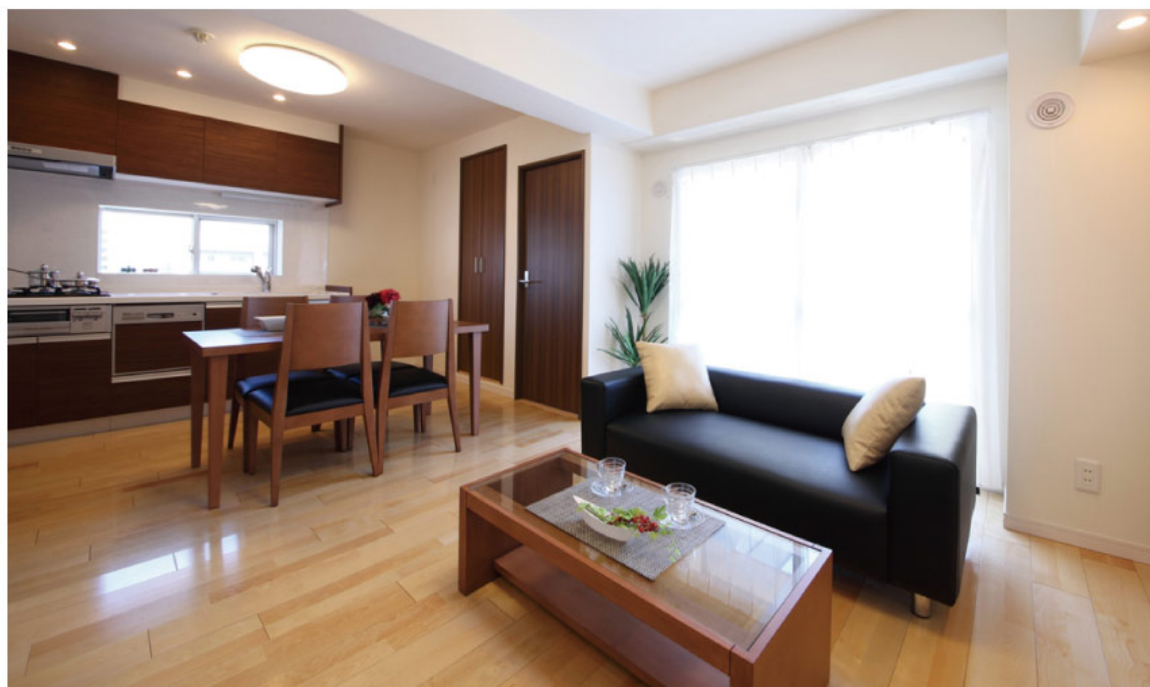
【イメージ写真】写真は一例ですので実際のものとは異なる場合があります。