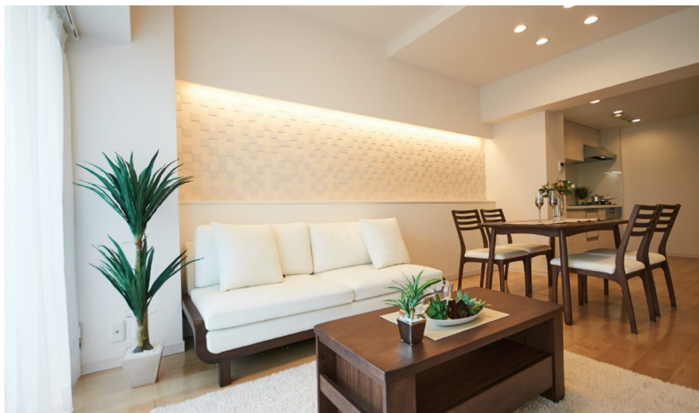
【イメージ写真】写真は家具の一例ですので実際のものとは異なる場合があります。